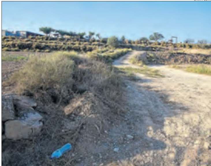
La macroquedada es va fer a l'antic camp de tir.

Van participar-hi joves de diversos municipis lleidatans, alguns d'ells amb bats de beisbol, segons l'alcalde. Els agents van fer diversos controls d'alcohol i drogues i hi va haver bastants positius, segons Fernández. També hi va haver danys materials a vehicles i cubs de la recollida d'escombraries porta a porta, així com alguna baralla, però no hi va haver ferits greus ni denúncies. La macrofesta va començar cap a la 1.30 hores i es va aconseguir dissoldre cap a les 6.00 hores.