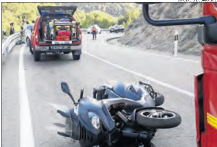
La moto accidentada ahir a la carretera A-211 a Mequinensa.

El conductor de la motocicleta, de 73 anys i marit de la víctima, va resultar ferit de caràcter greu i va ser traslladat a l'hospital Arnau de Vilanova de Lleida. Fins al lloc es van traslladar bombers de la diputació de Saragossa per col·laborar amb