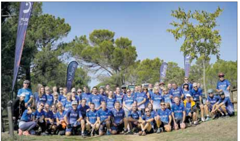
La xarxa de centres auditius Aural disposa de més de 25 centres arreu de Catalunya.

VINE A CONEIXE'NS I ET REVISAREM GRATIS L'AUDICIÓ Tel. gratuït 900 29 30 78 www.auralcentresauditius.es