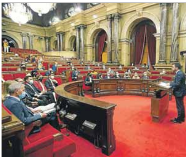
Pere Aragonès, durant la seva intervenció d'ahir a la tarda en el primer dia del debat de política general

La formació troba a faltar al·lusions a la confrontació amb l'Estat ■ El PSC i els comuns veuen "debilitat" l'executiu