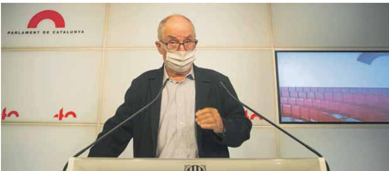
El síndic de greuges, Rafael Ribó, en una imatge d'arxiu al Parlament