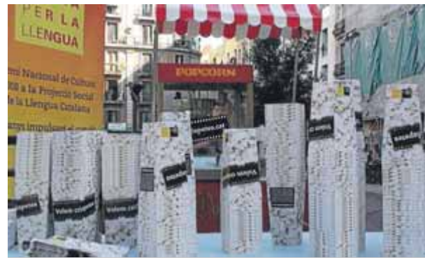
Una campanya a favor del català al cinema ■ EPA

Aquesta pugna es visualitza amb el fet que, a hores d'ara, hi ha dues iniciati-