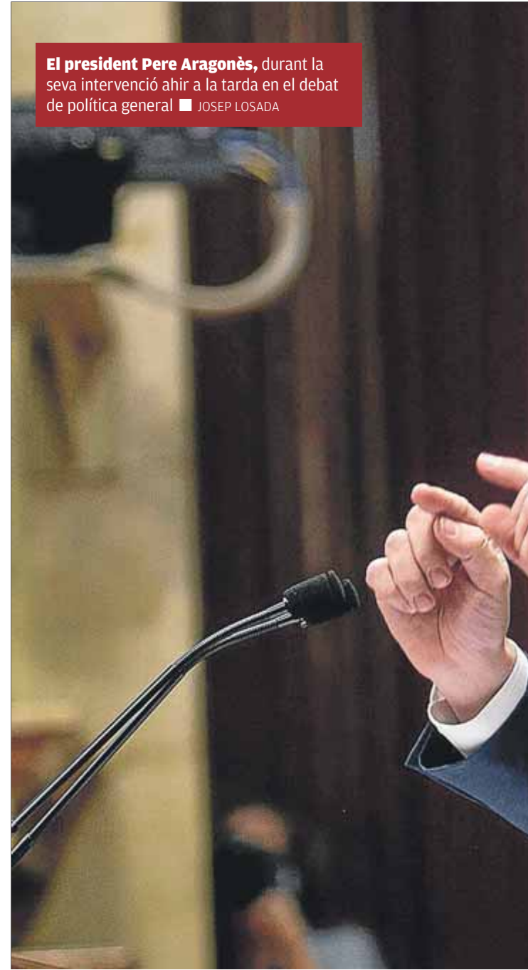
El president Pere Aragonès, durant la seva intervenció ahir a la tarda en el debat de política general

En qualsevol cas, quatre mesos després de ser investit, Aragonès va proclamar que la transformació del país “ja està en marxa”, ja que ha començat a implementar el programa de “canvis profunds” en el