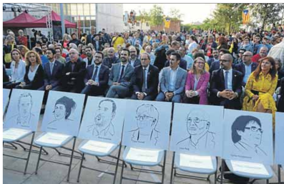
El govern de Torra commemorava el primer aniversari de l'1-0 a Sant Julià de Ramis ■ Q. PUIG

Diumenge, la Plataforma 3 d'Octubre organitza un acte a la plaça Cinc d'Oros de Barcelona, on, abans que comenci, confluirà la manifestació que organitza l'ANC des de la plaça de Francesc Macià. L'ANC informa que no cal inscriure-s'hi per participar en les marxes i en la manifestació, però sí en el concert de Figueres i en els actes d'Illa i Girona. ■