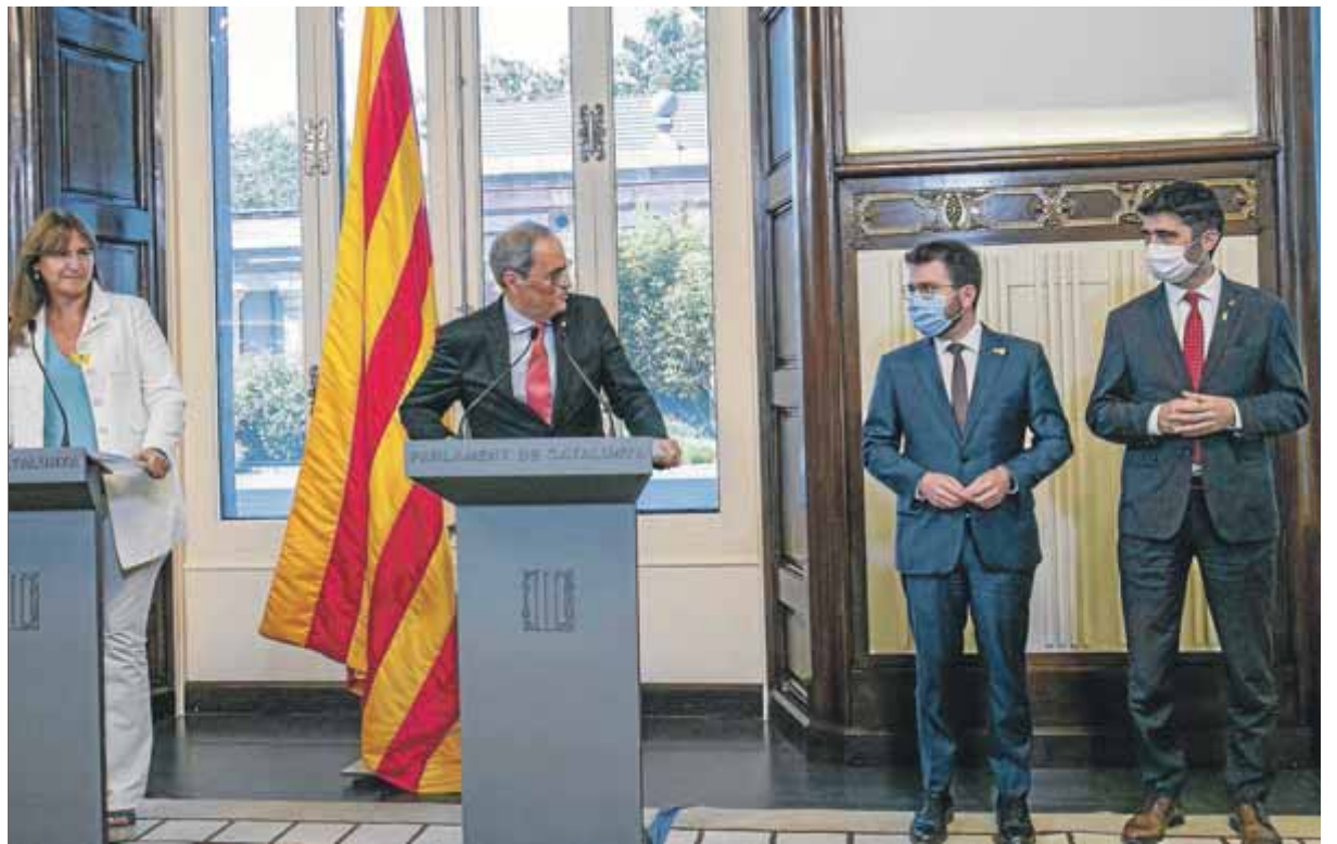
El president Torra entre els presidents Borràs i Aragonès i el vicepresident Puigneró ahir al Parlament