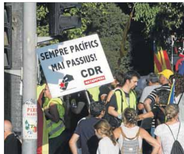
Acte de suport als CDR detinguts en l'Operació Judes, que es va dur a terme el 23 de setembre del 2019

Els advocats ja van anunciar ahir que presentaran escrits demanant la nul·litat de la resolució dictant el processament dels seus clients. Els CDR s'enfronten a penes que poden anar dels 8 als 15 anys de presó. ■