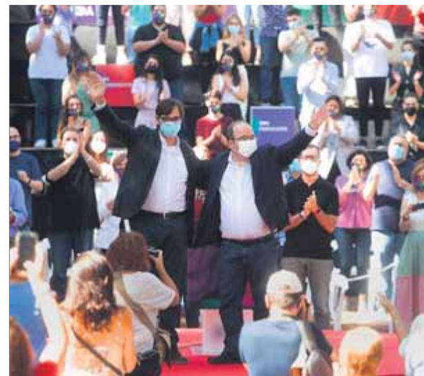
Salvador Illa i el ministre Miquel Iceta, en la Festa de la Rosa dels socialistes, a Gavà, ahir