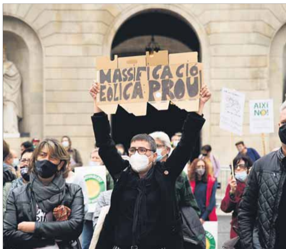
Protesta contra la massificació de projectes de renovables al maig a Barcelona

La modificació farà que es tingui més en compte la distribució territorial ■ Es pot arribar a un 50% el 2030