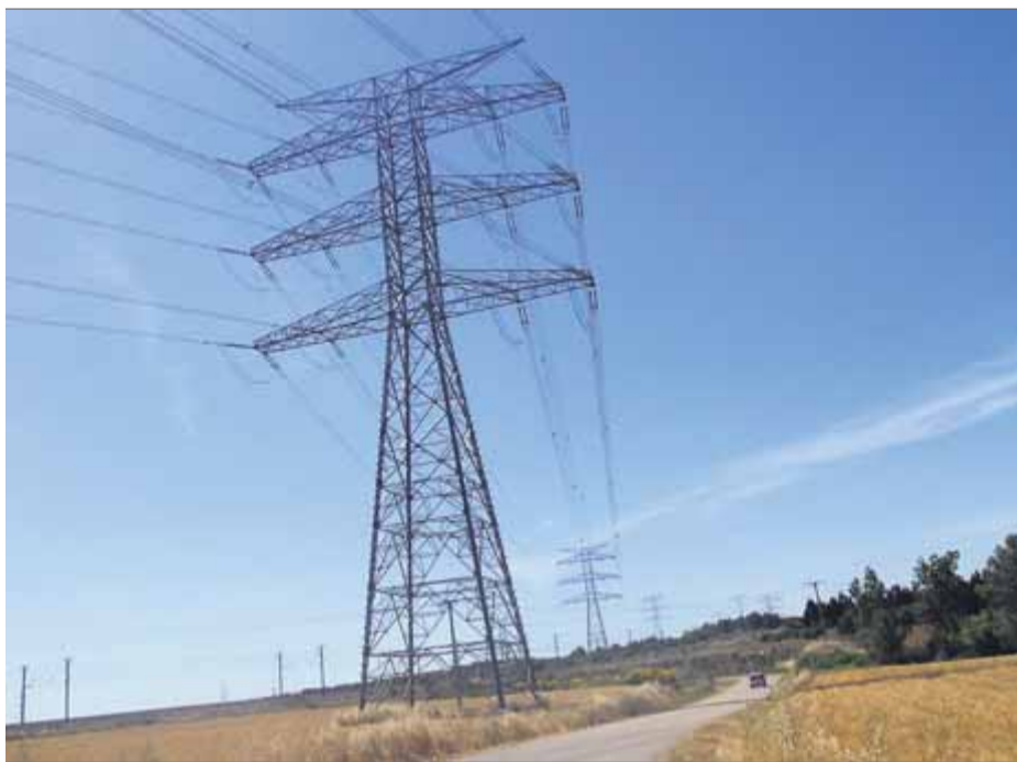
Torre de molt alta tensió com les que es volen instal·lar per transportar energia des d'Aragó ■

tècnics que han fet servir com a base per presentar al·legacions a la MAT.