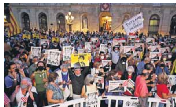
L'AMI ja va convocar concentracions divendres

"Diàleg, sí, però negociacions, no", assenyalava ahir el president a l'exili, Carles Puigdemont, quan li van preguntar per la taula de diàleg amb el govern espanyol. El motiu, assenyalava, és que "una part de l'independentisme no hi està asseguda perquè no hi ha estat convocada ni acceptada", amb referència a la no assistència de Junts a la taula. Puigdemont va obviar la decisió del president Aragonès de no acceptar els noms aportats per Junts perquè no eren membres del govern i en va culpar directament el govern espanyol, i va advertir que "pot fer la sensació que el govern espanyol només dialoga amb qui li dona suport parlamentari", va etzibar, amb referència a una ERC que va facilitar l'aprovació dels últims pressupostos de l'Estat i que ara podria facilitar l'aprovació dels nous comptes d'acord amb el pacte d'investidura de Sánchez. Puigdemont creu que a Sánchez no li agraden els que tenen una estratègia diferent i potser per això "tenia molt interès" en aquesta detenció.