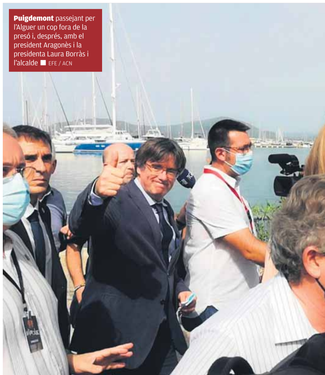
Puigdemont passejant per l'Alguer un cop fora de la presó i, després, amb el president Aragonès i la presidenta Laura Borràs i l'alcalde

Abans de la roda de premsa, Puigdemont es va passejar per la festa de cultura popular Adifolk i va rebre una gran quantitat