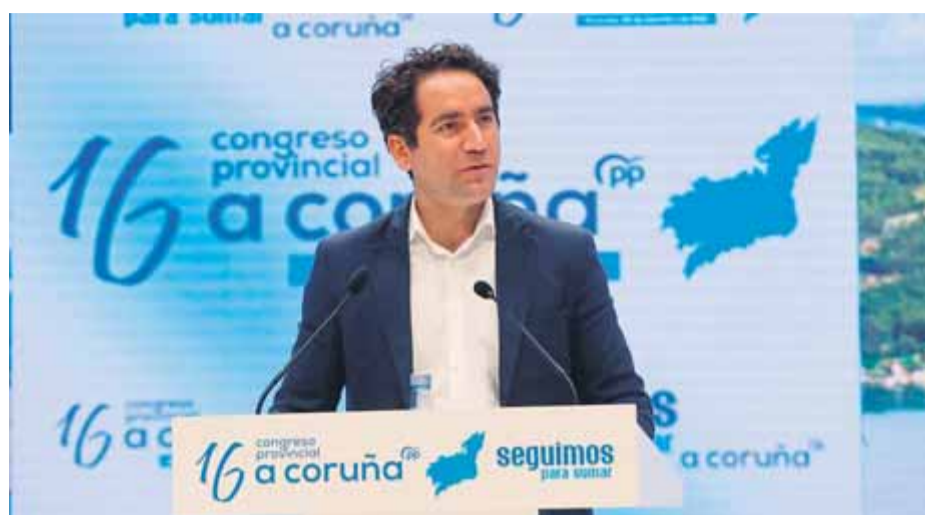
El secretari general del PP, Teodoro García Egea, ahir a la Corunya

pilotes fora i no va voler "fer valoracions de les resolucions judicials", per limitar-se a dir que "l'ordre europea de detenció és un diàleg entre tribunals de la UE". "Tot ciutadà reclamat per la justícia espanyola ha de comparèixer davant la justícia espanyola", repetia, com Sánchez la vigília. Segons el ministre, cal deixar que resolguin els tribunals de la Unió, a què pertanyen "tots els tribunals independentment del país". El secretari d'organització del PSOE, Santos Cerdán, va mostrar el seu "respecte i acatament" a la decisió judicial i va recordar que Puigdemont va marxar quan governava el PP. ■