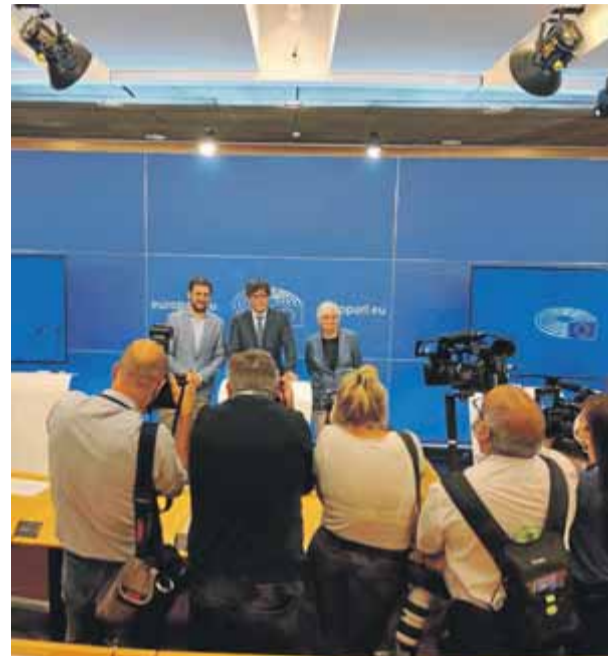
Puigdemont, Comín i Ponsatí en recuperar la immunitat com a eurodiputats, el mes de juny

És el cas de Clare Day, eurodiputada irlandesa membre d'Independents 4 Change, que es referia a la detenció com a “un flagrant abús de la legislació de la UE i una burla a l'estat de dret a Europa”. Day, que forma part del grup parlamentari europeu Esquerra Unitària Europea, avisa que la UE es quedarà de braços plegats mentre “alguns estats membres