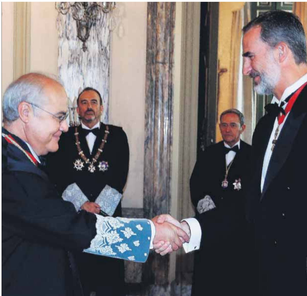
El jutge Llarena, amb Marchena al fons, saludant Felip VI en un acte del CGPJ