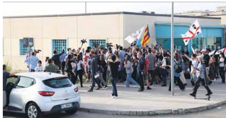
Periodistes i participants en l'Adifolk en la sortida de Puigdemont de la presó