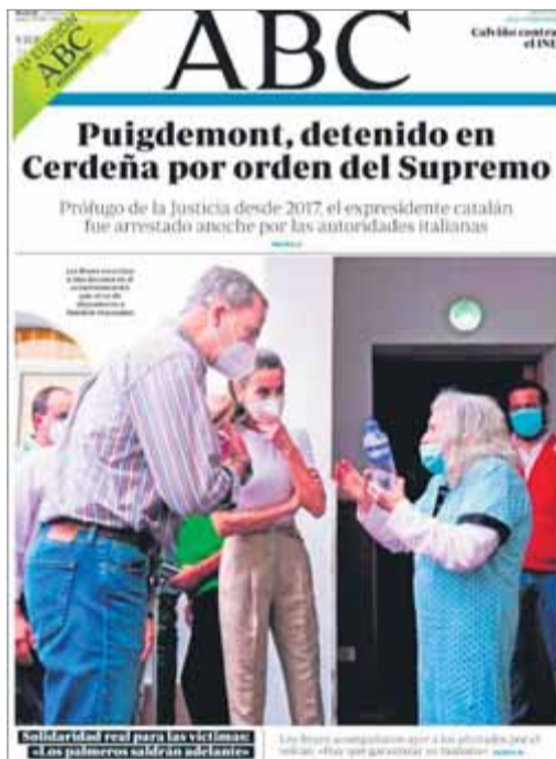
Puigdemont abans d'entrar a la presó de Neumünster, el 2018, i portades de la premsa espanyola ■ ACN

La premsa estatal, amb alguna comptada excepció, es va tornar a bolcar a fer de claca d'aquells que volen que la justícia espanyola passi comptes amb el president català. ■ ACN / EPA