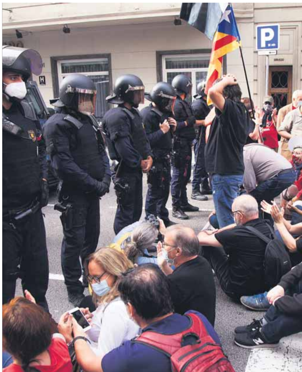
Alguns dels manifestants concentrats ahir al matí a la Diagonal proveïts de pancartes i d'altres asseguts davant el cordó policial dels Mossos d'Esquadra, impeding el pas a l'edifici del consolat italià