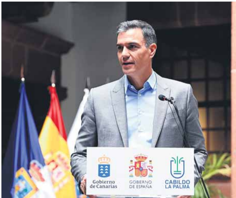
Pedro Sánchez va parlar ahir de la detenció de Puigdemont des de l'illa de La Palma

Per part dels socis de govern dels socialistes, la ministra de Drets Socials i secretària general de Podem, Ione Belarra, va assegurar des de l'illa de La Palma que el govern espanyol està "concentrat a aban-