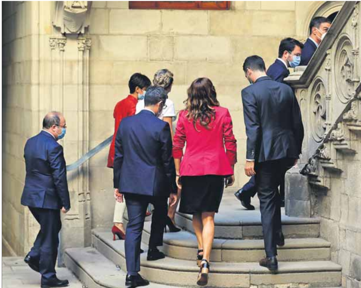
Les dues delegacions de la taula de negociació, el dia 15, quan es van reunir al Palau de la Generalitat

Aragonès, en tot cas, reconeixia que el seu gabinet va estar en contacte ahir al matí amb el de Pedro Sánchez per avaluar la situació i reiterar-li, segons ell, que l'amnistia i l'autodeterminació són l'única sortida possible al conflicte. Això sí, va evitar condicionar la continuïtat del diàleg a la retirada de les euroordres, com va exigir en nom del govern, i instava a conjurar-se per “superar els obstacles” per al diàleg.