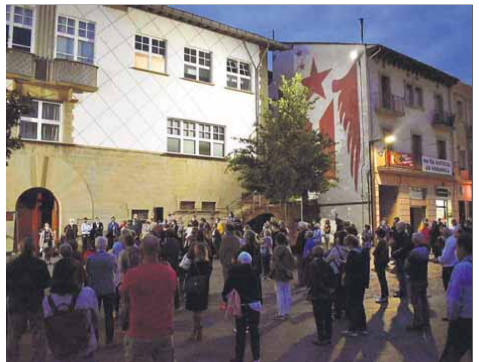
Imatges de les concentracions de Barcelona (a dalt) i Olot (a baix)

espanyol continua amb el “joc brut” i que actua amb “venjança i odi cap als nostres líders.”