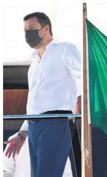
Matteo Salvini optaria per no extraditar ningú

Per la seva banda l'equilibrista Salvini, preguntat per la