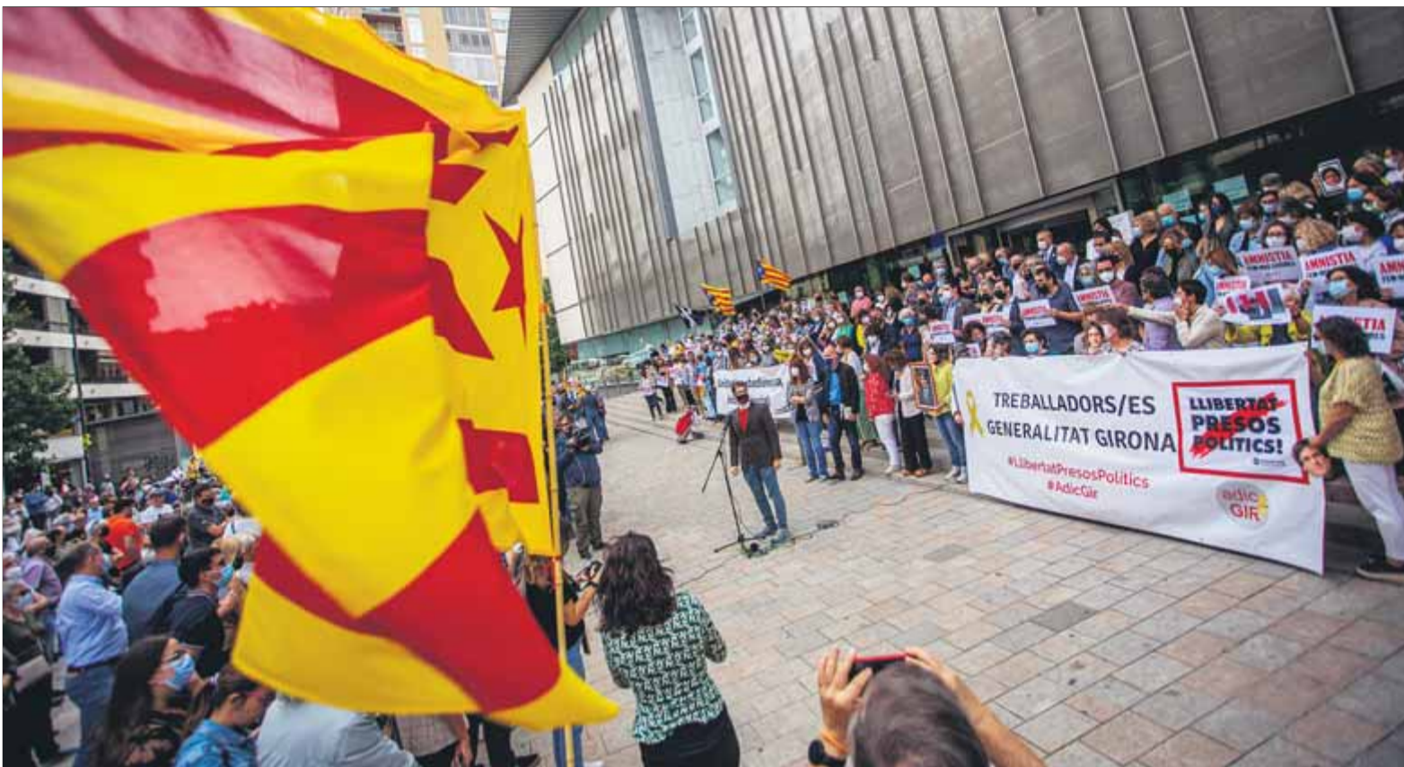
Un instant de la concentració d'ahir a la seu de la Generalitat a Girona, a la plaça Pompeu Fabra