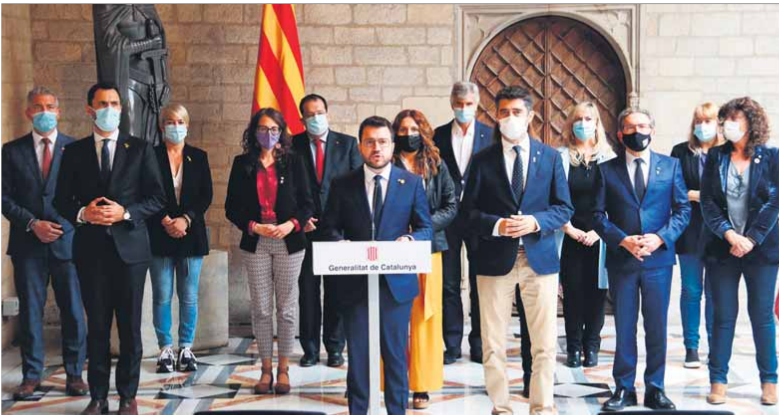
El president del govern, Pere Aragonès, acompanyat dels titulars de les conselleries, a la Galeria Gòtica del Palau de la Generalitat