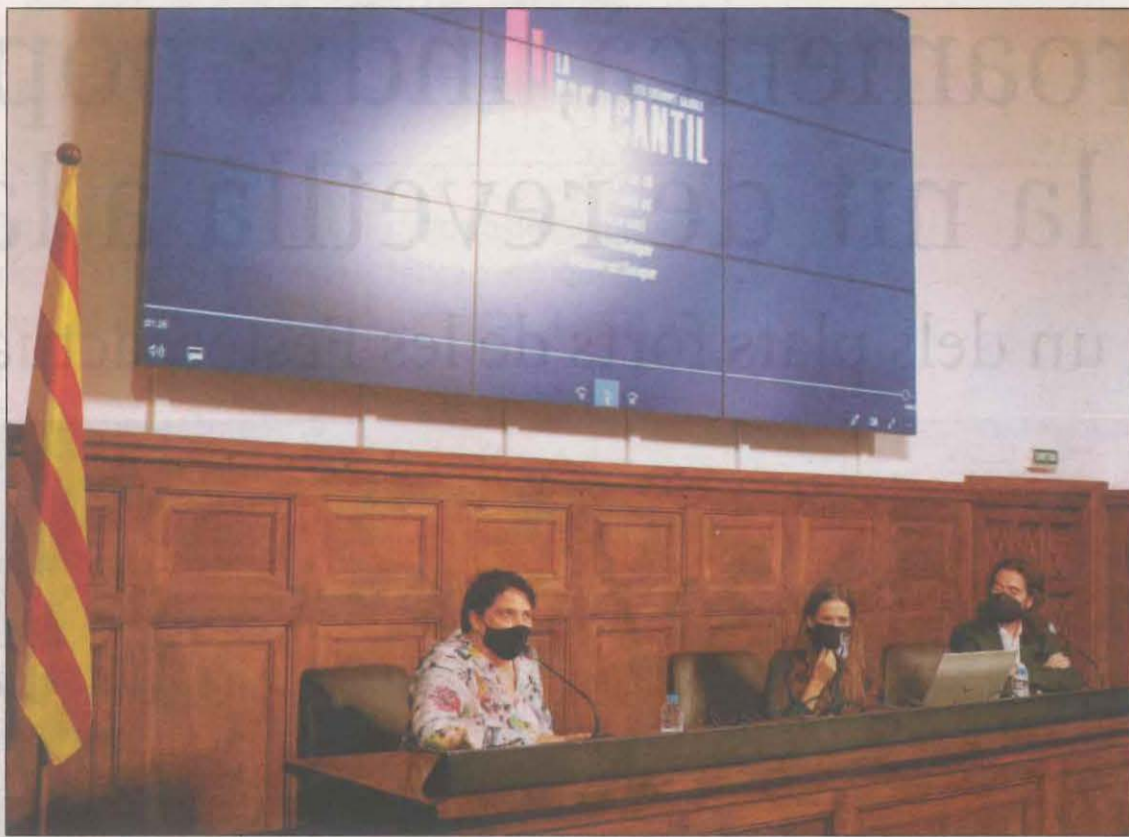
La nova sala s'estrena el 2 d'octubre amb un espectacle de la companyia A.K.A.

La jutgessa d'Osca va deixar en suspens la vista prèvia que s'havia de celebrar ahir en relació a les pintures murals del monestir de Vilanova de Sixena que es troben al Museu Nacional d'Art de Catalunya. És un nou procés judicial iniciat per la Generalitat per fer valdre el contracte de préstec signat entre Cultura i la comunitat religiosa.