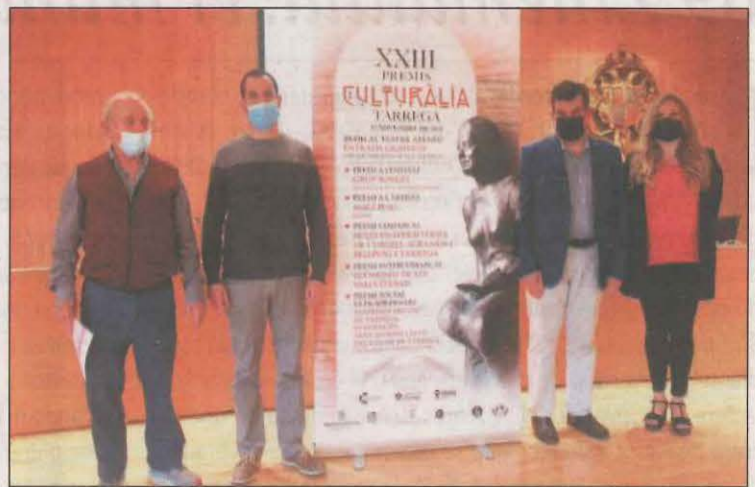
L'acte de lliurament és el 27 de novembre