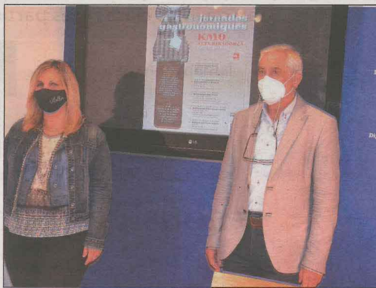
La presentació es va fer a la Diputació de Lleida