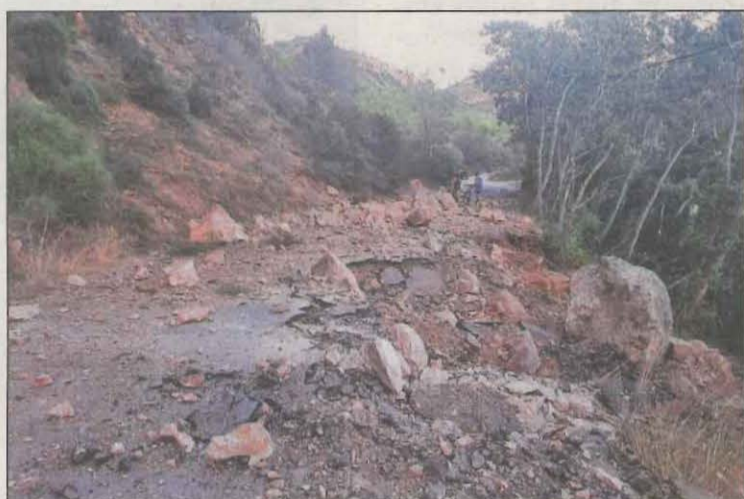
L'actuació ha deixat Camarasa sense telefon ni internet