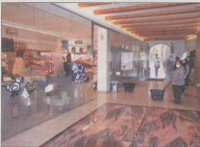
El certamen se celebrarà el dia 2 de setembre

pels infants. A més a més per a aquelles persones que presentin tiquets de compra amb una suma superior a 30 euros tindran un Mos-toc gratuït. D'altra banda, també es durà a terme un sorteig que porta per lema "El Guissonenc d'or", que consisteix en el sorteig d'un talonari valorat en un total de 100 euros a gastar a les botigues de Guissona.