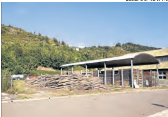
Imatge de l'actual magatzem de biomassa del Pont de Suert.

El primer edil va apuntar que aquest any també hauran d'estar a punt les noves calderes de biomassa que utilitzaran estelles dels boscos