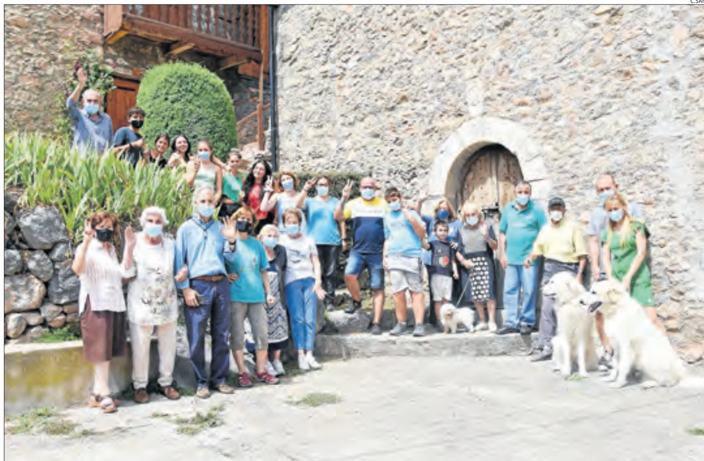
Vint-i-quatre veïns de segona residència del Querforadat (Cava) a la plaça del poble dimecres.

■ Aquests augments sobtats de població es registren majoritàriament als dos Pallars. No obstant, al pla també hi ha municipis com la Pobla de Cérvoles o els Omells que multipliquen el nombre de veïns.