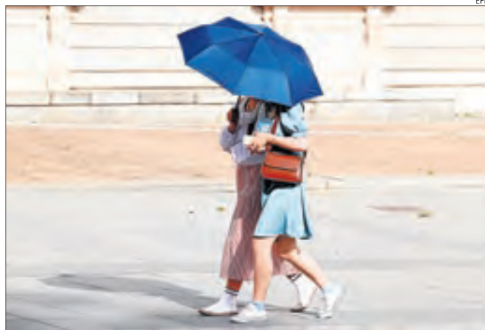
Dos persones eviten el sol amb un paraigua a Madrid.

Entre dimecres i dissabte a mitjanit, amb l'alerta de risc d'incendi extrem activada a tot Catalunya, els bombers van actuar en trenta focs de vegetació agrícola, vint-i-sis de vegetació forestal i vint de vegetació urbana.