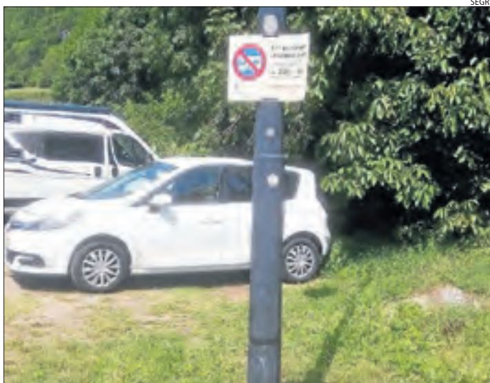
Un dels senyals que ha instal·lat l'ajuntament.

El consistori va començar a informar els conductors d'aquests vehicles dividint passat amb el reforç dels Mossos d'Esquadra, i es va incidir en el fet que està prohibit estacionar de les deu de la nit a les vuit del matí. L'àrea de Barruera és una zona de dia que permet l'estada de 8 del matí i ofereix servei per buidar aigües residuals i presa per al consum de boca.