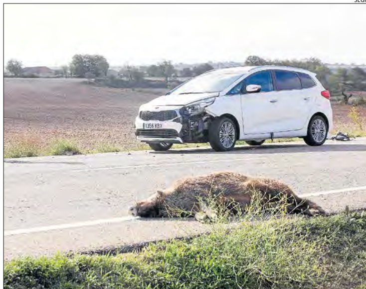
Imatge d'arxiu d'un accident amb un senglar a la Segarra.

En el que va del 2021, els 17 accidents causats per animals s'han saldat amb 19 ferits, tots lleus, segons Trànsit. Les carreteres amb un nombre més ele-