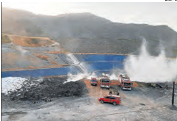
Incendi a l'abocador de Fígols ahir a la tarda.

D'altra banda, els Agents Rurals van denunciar ahir els organitzadors d'una sortida en dos autocars a la platgeta de Camarasa malgrat estar prohibides aquests tipus d'activitats en aplicació del pla Alfa per l'alt risc d'incendi en aquesta zona.