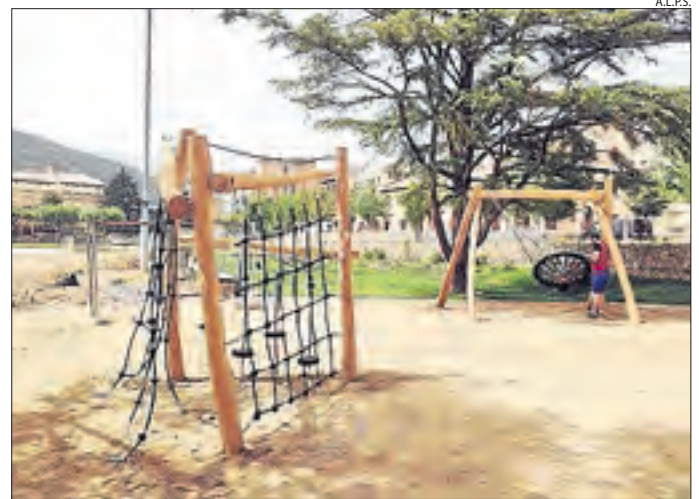
El parc infantil de la Pobla on s'han renovat jocs.