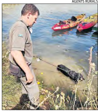
Un agent rural amb el gos.