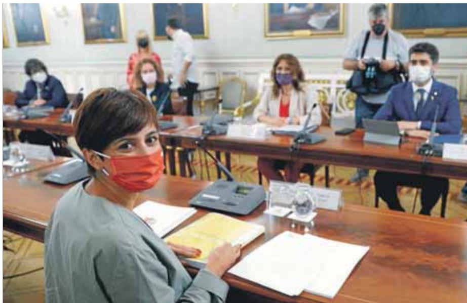
La ministra Rodríguez (Política Territorial), amb la consellera Vilagrà, el vicepresident Puigneró i la delegada Capella, en la bilateral Estat-Generalitat del 2 d'agost

MIR, "atac a la igualtat" A més de les peticions a les ministres Rodríguez –per la bilateral copresidida