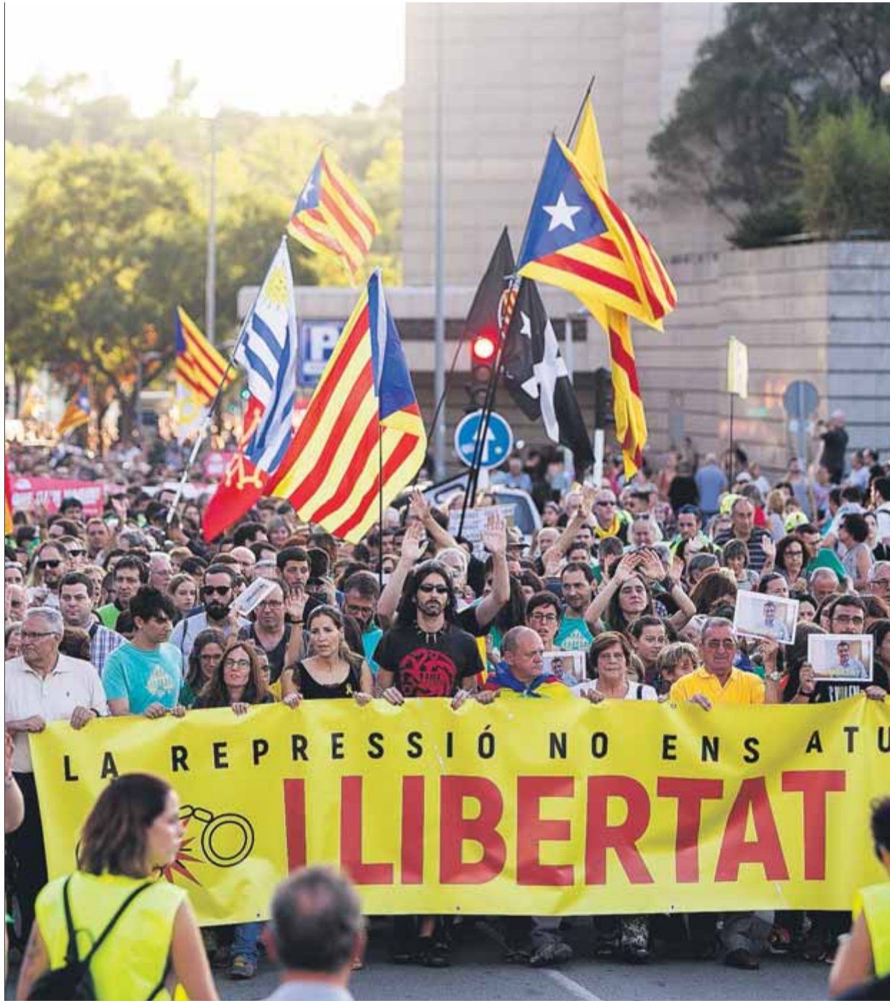
Manifestació a Sabadell per reclamar la llibertat dels set empresonats el 23 de setembre del 2019

La formació Alerta Solidària, que porta la defensa dels tretze encausats, assegurava ahir que novament no els havia arribat aquest escrit. Els investigats —afegeix la fiscalia— “com a membres de l'equip de resposta tàctica (ERT) haurien superat l'activitat dins dels respectius CDR i van formar una organització terrorista paral·lela, de caràcter clandestí i esta-