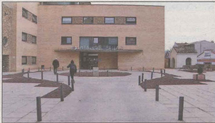
Hospital Comarcal del Pallars, a Tremp

D'aquesta mesura se'n podran beneficiar els pacients i acompanyants de les àrees de consultes externes, hospitalització, hospital de dia o rehabilitació, així com els acompanyants de menors o de persones vulnerables que s'hagin de vacinar o que estiguin ingressades.