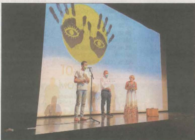
El acto inaugural resultó de lo más ameno