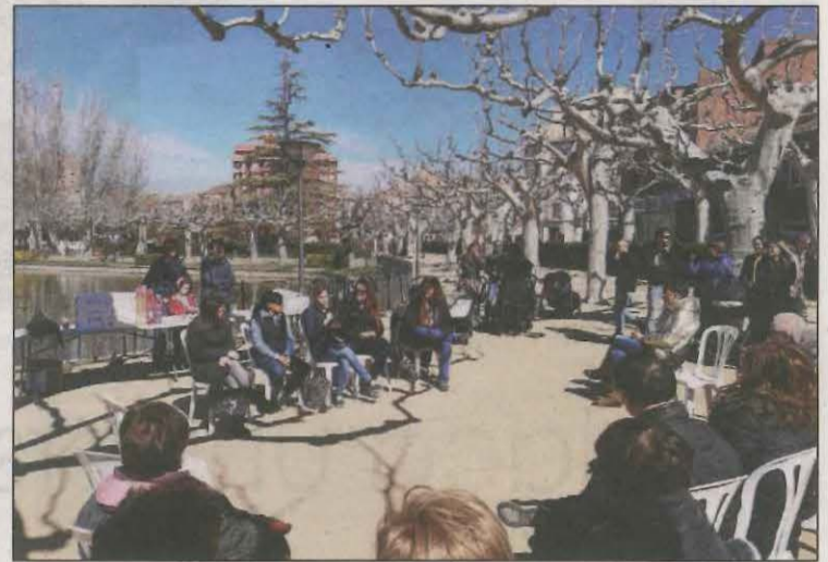
S'han fet diversos actes per preparar el Pla

En concret, el consistori borgenc ha adjudicat un contracte, per valor de 5.082 euros amb càrrec al pressupost general 2021, a l'Associació General Feminismes i Transformació Social, amb l'objectiu de donar continuïtat al Pla d'Igualtat 2017-2021 i definir aquest nou document amb què es regirà el consisto-