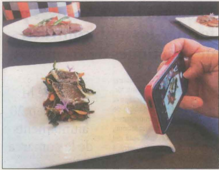
Es vol incentivar la creació de nous productes