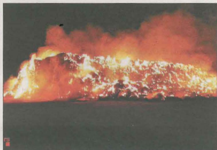
Moment en què cremava el paller de Balaguer