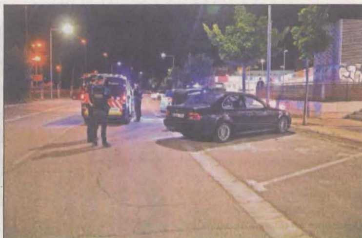
La policia farà controls nocturns als municipis afectats

Aquestes limitacions s'aplicaran a partir d'aquest dijous