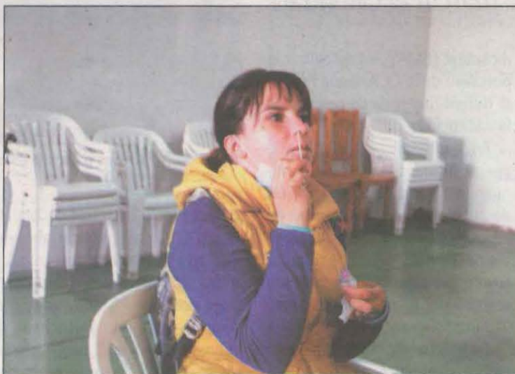
Els tests que es faran avui seran d'automostra

l'Alt Urgell és de 713,03, un dels més alts de la demarcació de Lleida, només superat pel Pallars Sobirà i el Pallars Jussà. El de la Cerdanya, en canvi, es força inferior: 440 punts. Així i tot, cal recordar que el departament de Salut considera que a partir dels 100 punts la comarca es troba en un "risc alt" de rebrot i passa a ser una comarca "vermella". Aquesta és una situació en la que ara mateix es troben totes les comarques de Catalunya, ja que totes superen els 100 punts de l'índex de rebrot a causa de l'impacte de la cinquena onada del coronavirus al país, estimulada per la variant delta.