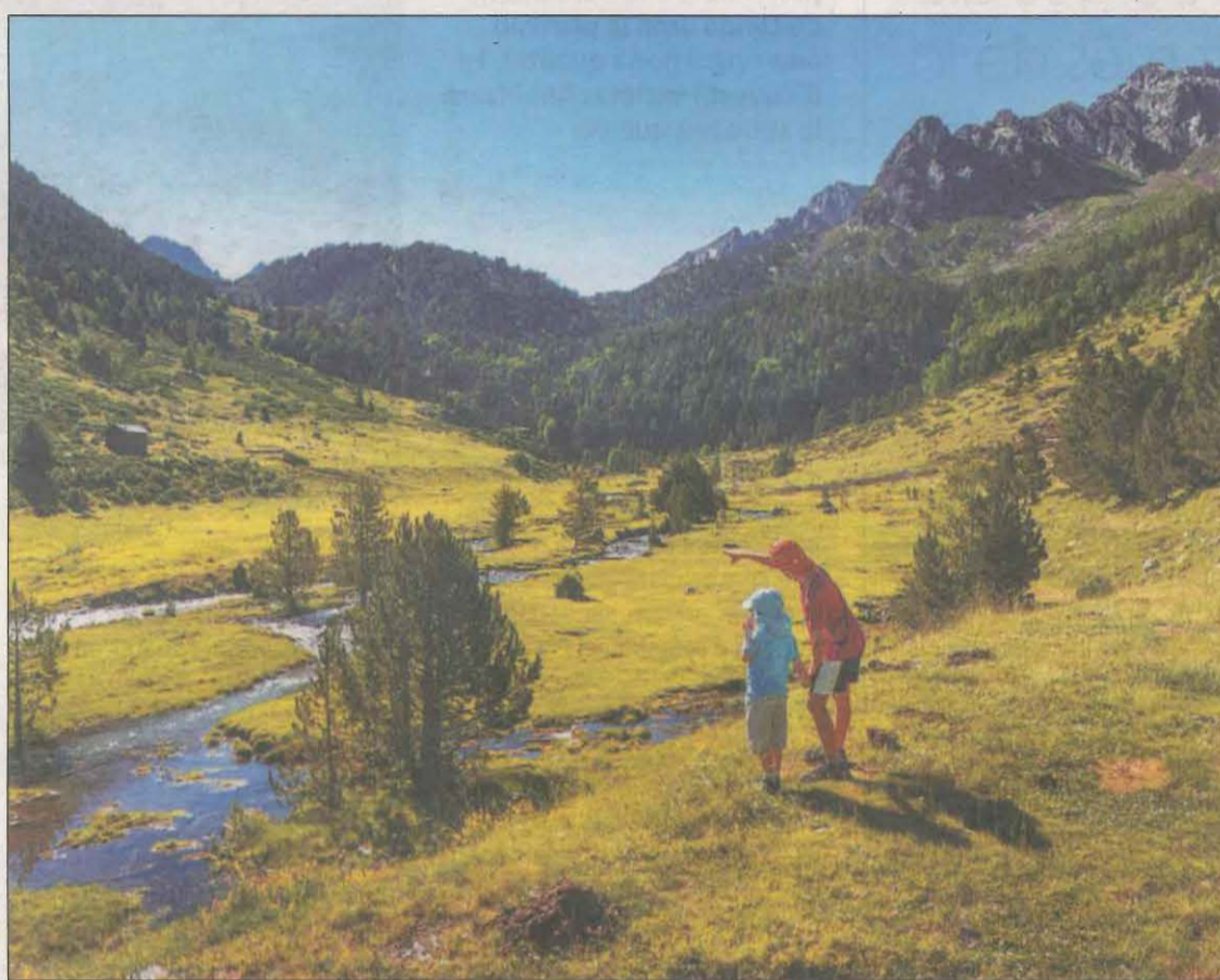
La vacunació i l'oferta de turisme de natura han estat clau per 'aguantar'

Les dades d'aquest mes són superiors a les del 2020 i a les del 2019 en el conjunt de l'Aran, fet que té relació amb la celebració de competicions i esdeveniments que enguany s'han pogut realitzar a la Val. Ha estat gràcies als organitzadors d'aquestes proves, que han comptat amb el finançament de les administracions araneses, que els ha donat a conèixer com un destí turístic d'estiu amb una gastronomia i uns serveis d'excel·lent qualitat i una gran diversitat en l'oferta d'activitats relaciona-