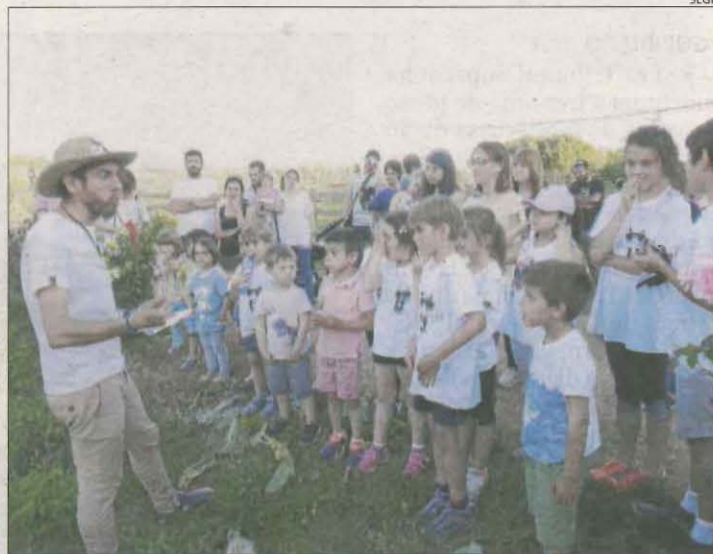
Imatge d'una activitat del 'Benvinguts a Pagès' del 2019.

Aquestes activitats ja es poden reservar al web totlany.benvingutsapages.cat . En el conjunt de Catalunya hi ha un centenar d'explotacions que