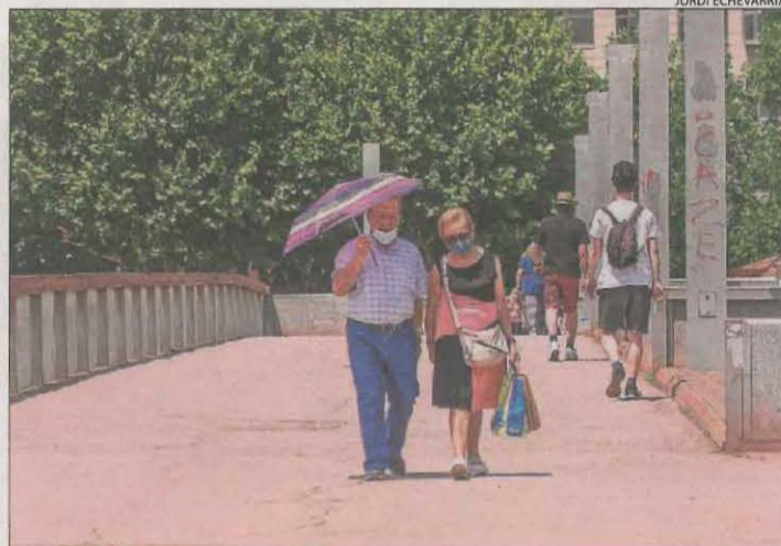
Una parella es protegeix del sol amb un paraigua a Lleida.

El rànquing de màximes catalanes, que va estar liderat per la barcelonina Artés amb 38,5 graus, el van comple-