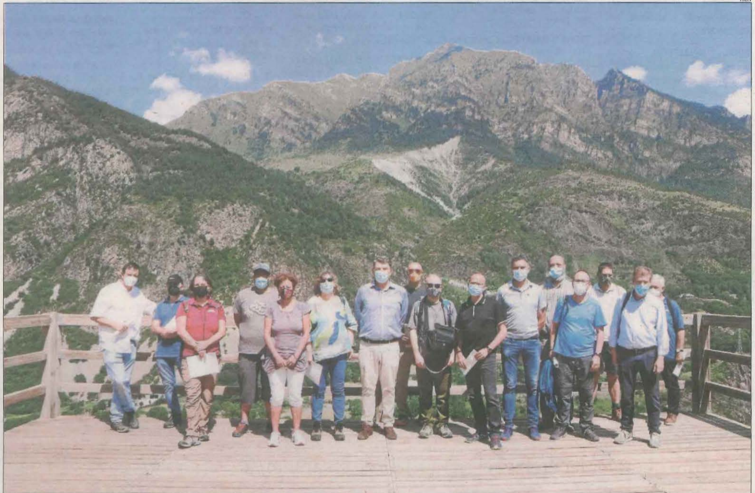
Foto de família dels impulsors i participants en el projecte Phusicos, durant la presentació ahir al barranc d'Erill.

D'altra banda, els experts han considerat aquesta zona com un laboratori a l'aire lliure per poder monitorar determinats comportaments del terreny, abans, durant i després de la intervenció i aplicació d'aquestes tècniques "verdes", amb una combinació de vegetació per limitar l'erosió i construccions de fusta local per minimitzar l'energia dels rierols.