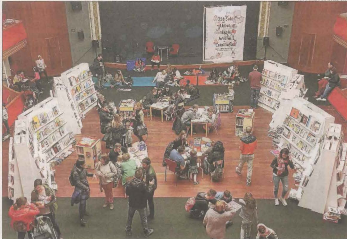
Una vista del Saló del Llibre Infantil al Teatre de L'Amistat el 2019, l'última edició celebrada.

Per la seua part, el Consell Català del Llibre Infantil i Juvenil treballa ja en "noves fórmules per impulsar la presència i la difusió de la literatura infantil i juvenil catalana a tot el país". En el comunicat conjunt, "les dos entitats celebren tots aquests anys d'acció compartida que els han permès acompanyar la formació de milers