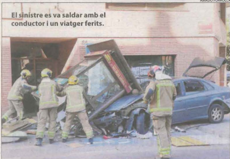
El sinistre es va saldar amb el conductor i un viatger ferits.