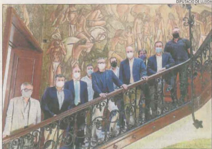
El comitè organitzador de Datagri a la Diputació.