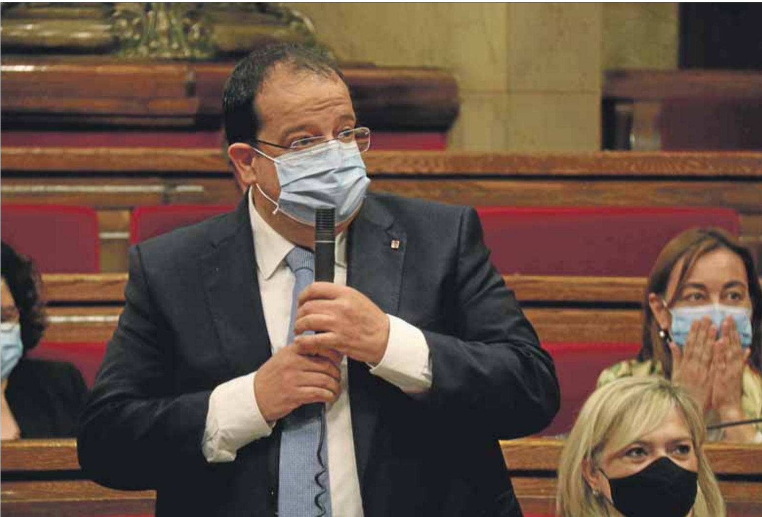
El conseller d'Interior, Joan Ignasi Elena, durant la sessió de control al govern en el transcurs del ple que es va fer ahir al Parlament