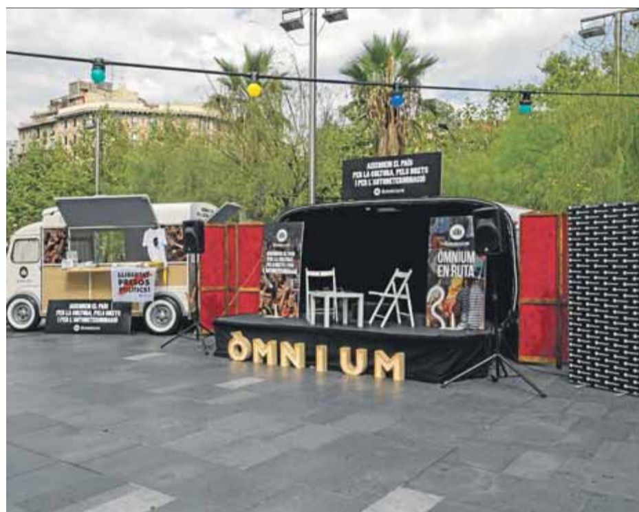
Aquest és l'espai polivalent i mòbil, amb una caravana inspirada en el bibliobús d'Òmnium dels anys setanta, que recorrerà diverses poblacions de Catalunya ■ ÒMNIMUM CULTURAL

La iniciativa coincideix enguany amb la commemoració del seixantè aniversari de l'entitat, i a l'espai al voltant de la caravana mòbil hi haurà plafons on se n'explica la història i la trajectòria. Seguint les