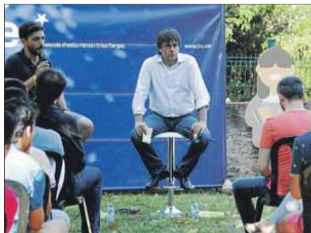
L'edició del 2016 va tenir Puigdemont com a ponent ■ ACN

En un escrit tramès a tota la militància, l'organització independentista sosté que ha pres aquesta decisió arran de l'empitjorament de la situació sanitària, que ha comportat l'establiment de noves mesu-