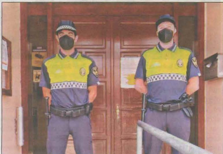
Els dos nous funcionaris nomenats per l'ajuntament

L'Ajuntament d'Alpicat ha reforçat la vigilància municipal amb la incorporació de dos nous funcionaris. Un cop superat el període de pràctiques, mitjançant un Decret d'Alcaldia s'han nomenat funcionaris de carrera. Per aquesta decisió s'han acreditat diversos factors de conducta i coneixements del treball, entre d'altres.