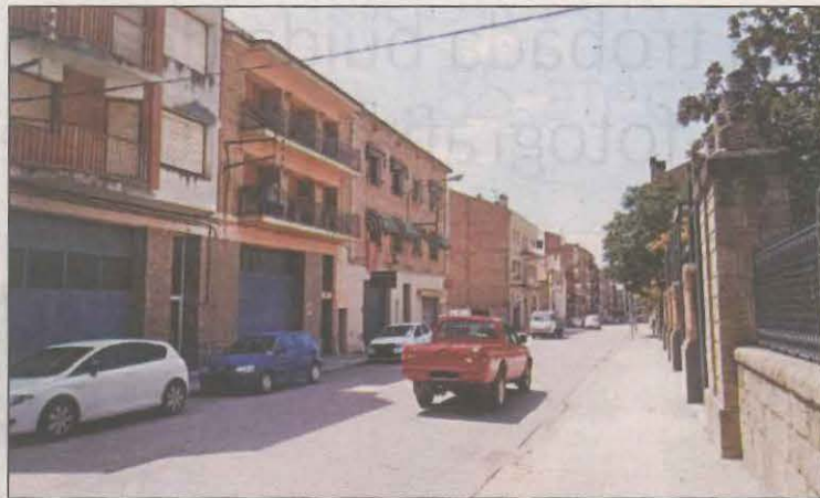
Imatge d'un dels carrers on es podria posar el radar

El radar mòbil s'instal·larà en diferents emplaçaments del nucli urbà. Els criteris per decidir aquestes ubicacions combinen les dades derivades de l'anàlisi de la sinistralitat al municipi, de detecció d'excés de velocitat per part dels vigilants i per demandes veïnals. Des de l'Ajuntament van recordar la importància de respectar els límits de velocitat i la necessitat d'adaptar la conducció