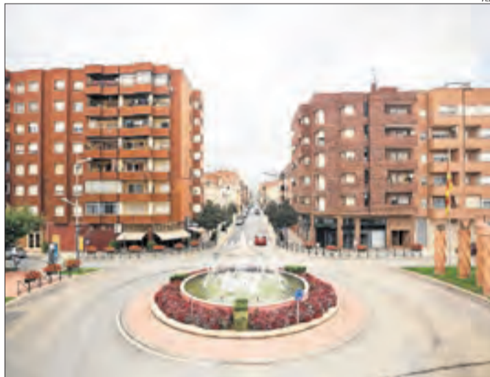
Vista d'Almacelles, on ahir va tenir lloc l'agressió.

En els últims dies, s'han produït altres episodis violents. A Lleida ciutat, la Guàrdia Urbana va actuar en quatre agressions violentes en una setmana. L'últim es va produir el passat 28 de maig, quan dos joves van agredir un home amb una fusta amb claus i un ganivet al carrer Pallars. Dies abans havien arrestat una parella per tres assalts a punta de navalla en ple carrer i un jove que va agredir i en va amenaçar un altre també amb una navalla.