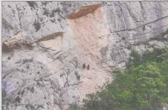
Malgrat estar els accessos tallats, els turistes passen pel sender.