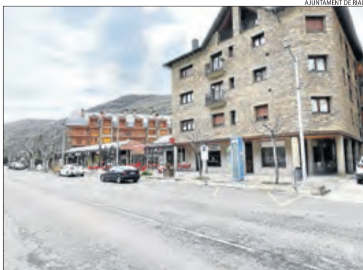
El tram de l'avinguda Flora Cadena que serà renovat.

Les obres compten amb un pressupost de 41.000 euros i amb una ajuda del pla de dinamització local de la Diputació de Lleida.