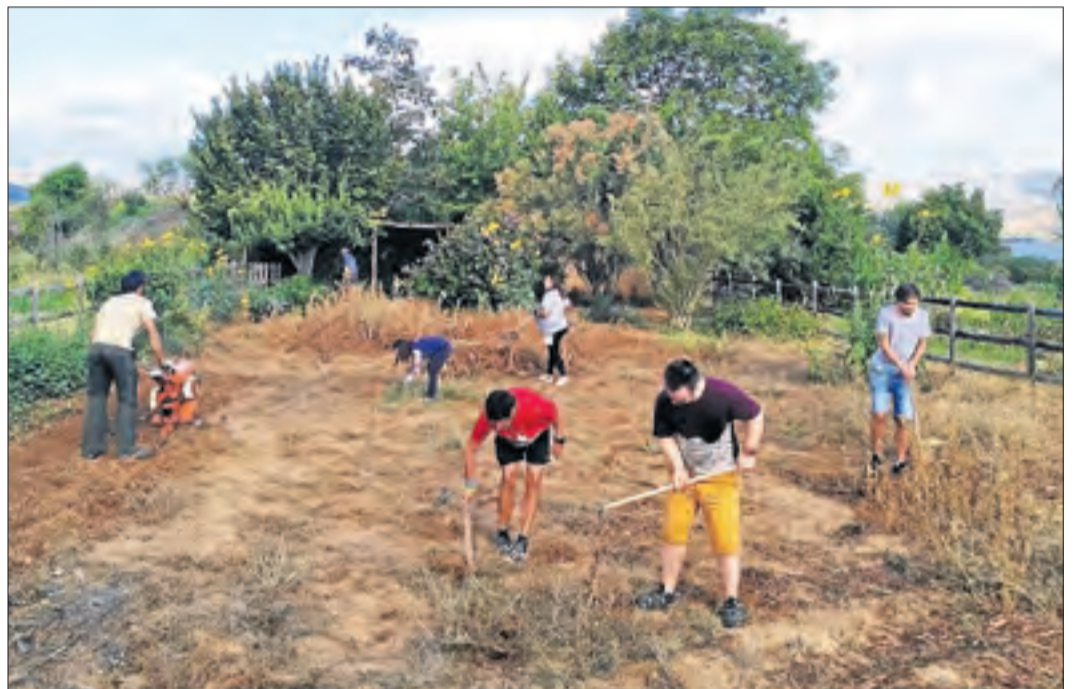
Els membres de la Cooperativa Alba Jussà treballen a l'hort.

Les llavors recollides han hagut de ser guardades o plantades al mateix poble durant cinquanta anys