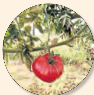
Rosada del riu Flamisell.