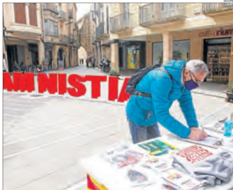
La recollida de firmes al carrer del Carme de Tàrrega.

TÀRREGA | Òmnium Segarra-Urgell va recollir ahir firmes en aquestes dos comarques a favor de l'amnistia dels polítics a la presó. A Tàrrega, va desplegar unes grans lletres que formaven la paraula amnistia , primer a la plaça Major i després al carrer del Carme. Hi va haver parades a Agramunt, Bellpuig, Cervera, Guissona, Tàrrega i la Seu d'Urgell (vegeu la pàgina 22) i en altres municipis catalans.