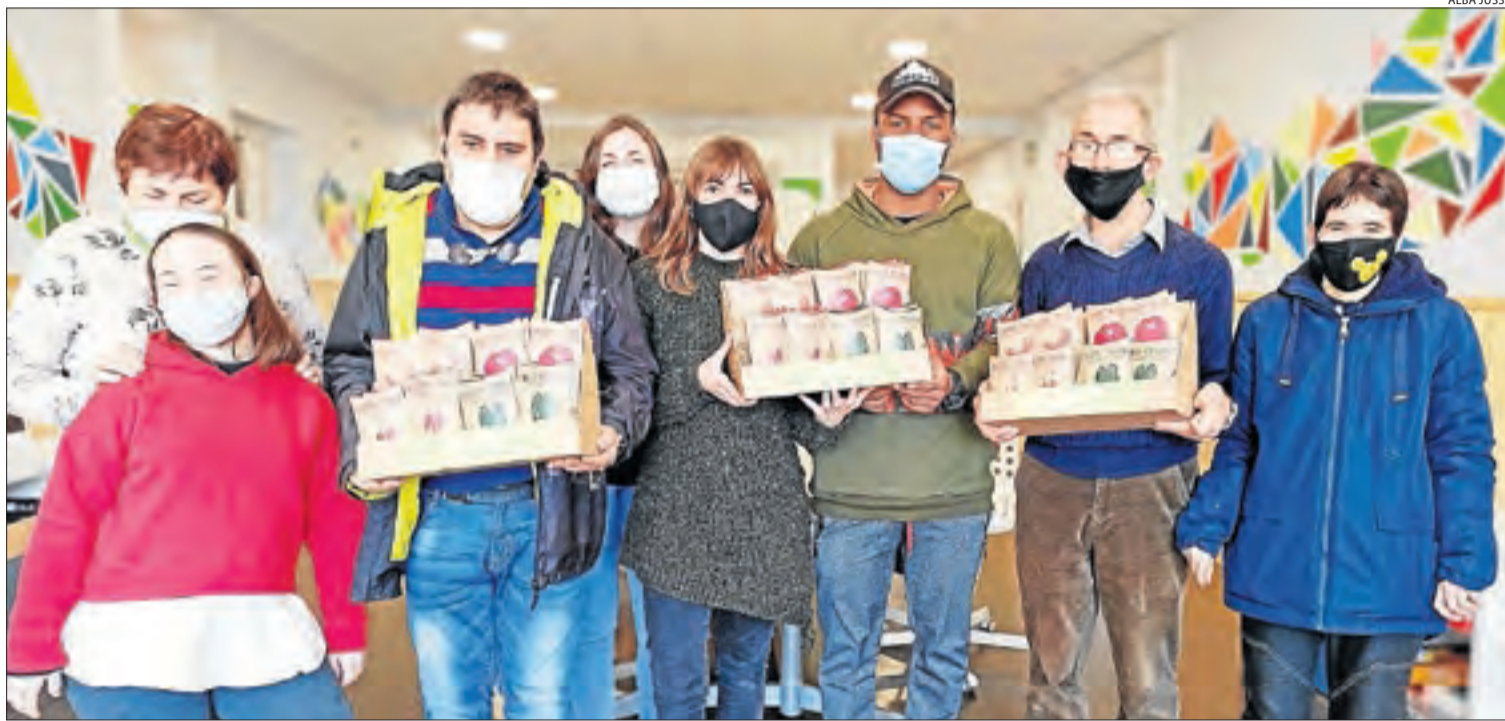
Els integrants del projecte mostrant les quatre varietats de llavors que van sortir a la venda el mes de març passat.