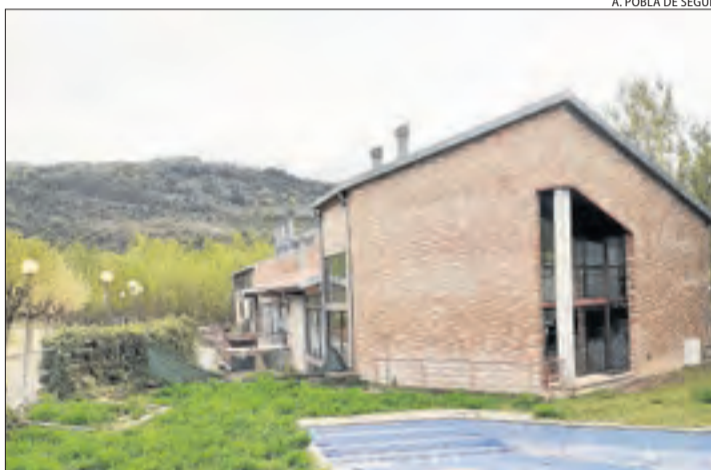
L'Espai Raier que el consistori cedeix per a l'institut.

plicar que la construcció del camp de futbol s'emmarca en el projecte del centre específic de formació professional d'esports de muntanya que ha d'acollir l'Espai Raiers. "Tení-