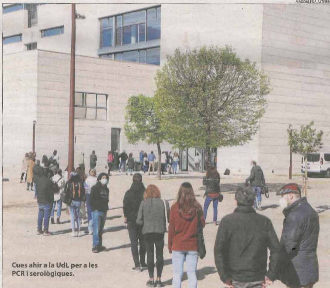
Cues ahir a la UdL per a les PCR i serològiques.

L'EMA dona suport a la vacuna d'Oxford tot i els vincles amb els trombes i a Espanya sols s'administrarà a entre 60 i 65 anys.