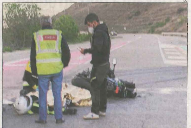
Imatge del motorista ferit a l'accident de Balaguer.

BALAGUER | Dos motoristes van resultar ferits greus ahir en sengles col·lisions a Balaguer i Castellldans. El primer accident es va produir a les 7.49 hores a la C-12 al terme municipal del Balaguer, quan van col·lidir un camió i una motocicleta. El motorista va ser evacuat en ambulància a l'hospital Arnau de Vilanova, segons va informar el Sistema d'Emergències Mèdiques (SEM), que va activar dos unitats. En el dispositiu també van participar dos dotacions dels Bombers de la Generalitat i diverses patrulles dels Mossos d'Esquadra. L'accident ha obligat a donar pas alternatiu a la circulació a la carretera, cosa que va provocar retencions d'un quilòmetre, segons va informar Trànsit. L'altre accident es va produir a les 16.00