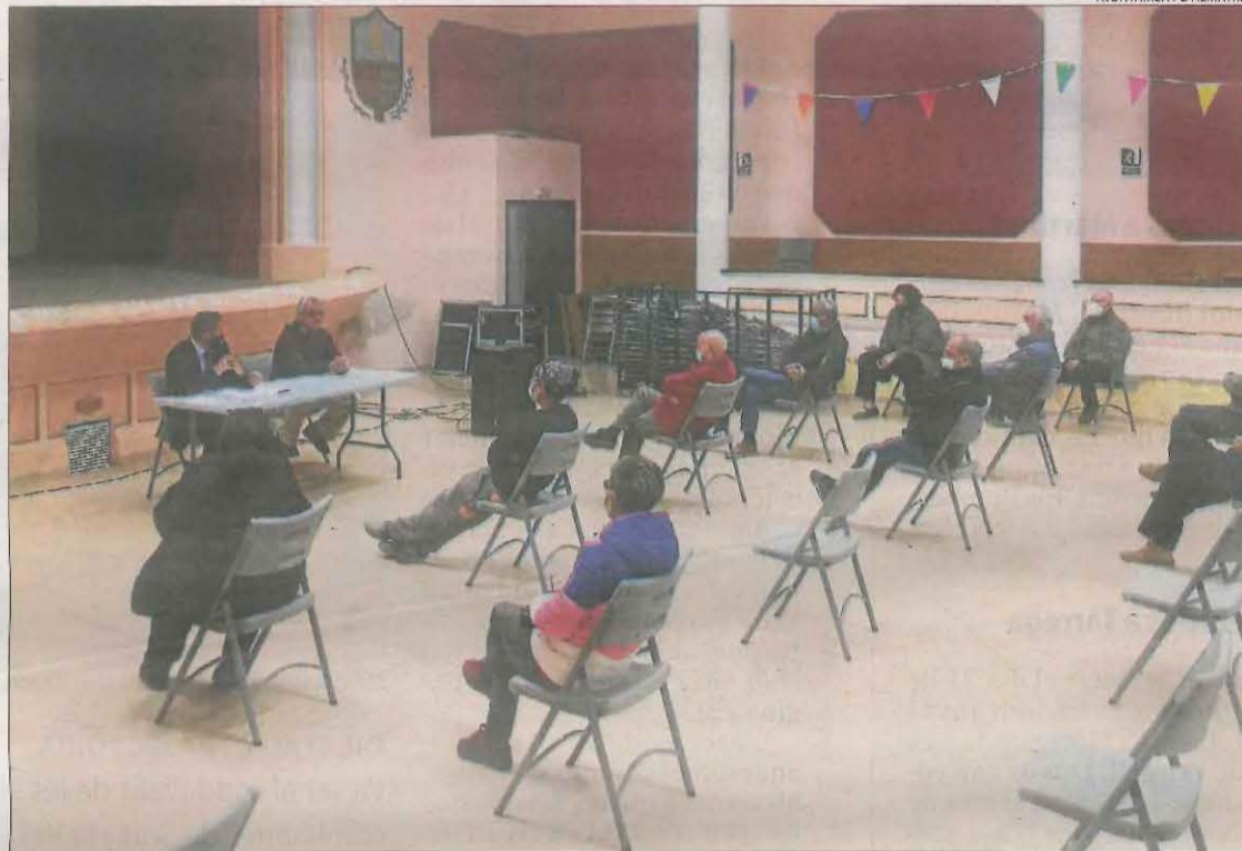
La reunió que es va fer ahir a Almatret per assessorar els veïns.

Alguns contractes estableixen pagaments variables als propietaris dels terrenys, en funció de l'energia que produeixen cada any els aerogeneradors i els panells solars. En el cas dels molins, la xifra pot variar en uns 4.000 euros anuals. També poden condicionar l'inici dels pagaments a l'entrada en servei de la central eòlica o solar prevista, i impedir fins aleshores que el propietari de la finca en faci ús. Això pot suposar un seriós problema quan les obres es dilaten molt més del previst, cosa que passa amb freqüència. Fins i tot hi ha contractes que inclouen la possibilitat de subrogar el projecte a tercers.