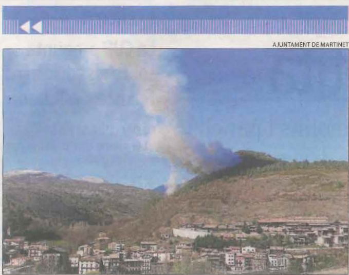
AJUNTAMENT DE MARTINET