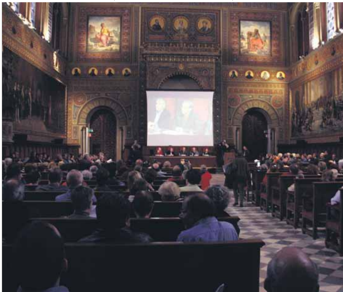
Presentació del manifest al paranimf de la Universitat de Barcelona, ara ha fet cinc anys

La premsa se'n va fer un ampli ressò i moltes respostes ens van fer valença. Tanmateix, també vam rebre moltes crítiques de persones que ens acusaven de coses que nosaltres no havíem dit, d'algunes amb les quals discrepem i fins i tot d'altres que combatem. Intentar alertar del procés de substitució lingüística que vivim i apuntar les bases per mirar de revertir-lo ens va valdre el qualificatiu de racistes i supremacistes per part de moltes de les persones i entitats sempre hostils a qualsevol esforç per evitar la situació d'ús subordinat sistemàtic en què vivim com a condició sine qua non per a la reversió del procés de substitució lingüística que hi ha engegat, unes persones i entitats que, per les afirmacions que feien, mostaven que no s'havien ni pres la molèstia de llegir amb rigor el manifest i encara menys el document en què s'exposa àmplia-