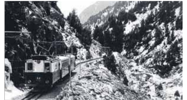
El cremallera de Núria, en una imatge dels anys vuitanta

lització de les instal·lacions i d'arribada de nou material mòbil. Es van posar en servei quatre nous automotors, es van modernitzar les locomotores i els cotxes de viatgers, es van construir els tallers i es van substituir les vies. Anys després es va construir la nova cotxera de Ribes-Enllaç, es va remodelar l'estació de Querolbs, va entrar en servei el nou túnel del Roc del Dui i es van adquirir nous automotors. Actualment el tren cremallera de Núria rep més de 280.000 visitants anuals, realitza una travessa de 12,5 km i supera un desnivell de 1.000 metres en 40 minuts. Durant el seu recorregut passa per les estacions de Ribes-