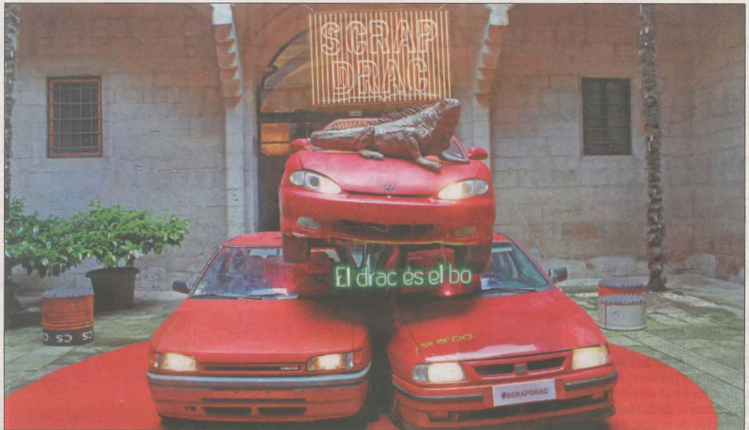
El muntatge, format per tres cotxes, una iguana i un cartell de neó, s'acompanya d'una banda sonora de música electrònica