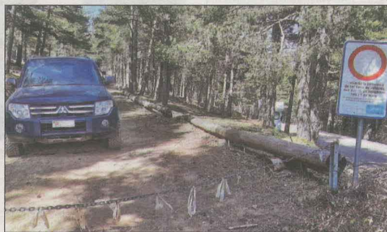
Un vehicle en un camí de la Vall de Santa Magdalena

tardor passada, es busca garantir la seguretat, la conservació d'aquestes pistes d'alta muntanya i minimitzar l'afectació que té la circulació motoritzada en espècies com el gall fer. Queden exempts de les mesures els propietaris de les finques que es trobin dins de l'àrea, els beneficiaris dels béns de les forests de titular comunal o els que hi desenvolupen activitats del sector primari, a més del pas de vehicles d'emergències o els serveis públics. També es poden sol·licitar permisos de pas temporals.