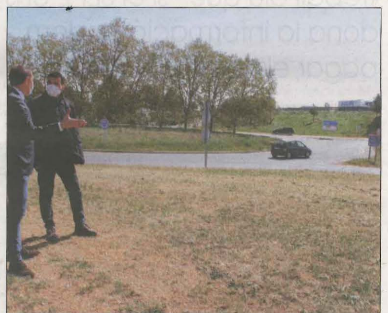
Té un pressupost d'adjudicació de 7,6 milions