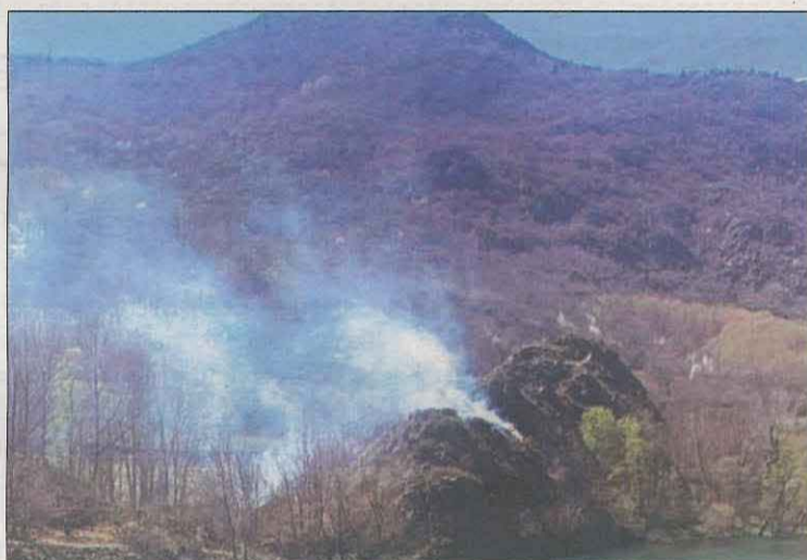
Imatge del lloc on es va originar l'incendi de l'Alt Àneu

Els Bombers van apagar ahir un incendi de vegetació que es va originar al costat del pantà de Borén, a l'Alt Àneu, en una zona inaccessible. El perímetre del foc es va haver de rematar amb eines manuals i van treballar cinc dotacions i un helicòpter. També van apagar petits incendis a les Borges, Corbins, Bellpuig i Juneda.