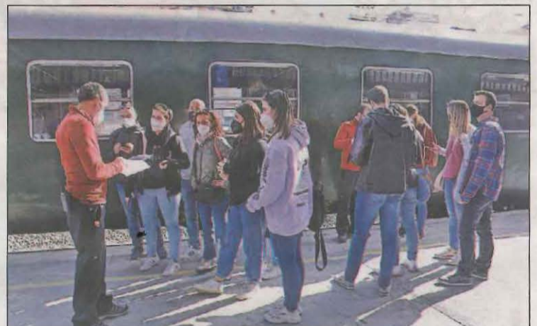
S'incorpora la novetat de poder comprar els bitllets en línia

La principal novetat d'aquesta temporada és la posada en marxa d'un nou lloc web que incorpora el servei de venda anticipada de bitllets i que permet als usuaris assegurar-se la disponibilitat del trajecte el dia que volen fer el viatge. A banda d'això, es mantenen les mesures de protecció per fer front a la Covid-19. Així, s'han instal·lat dispensadors de gel hidroalcohòlic, s'han senyalitzat les mesures anticovid i s'ha reforçat el servei de neteja i desinfecció.