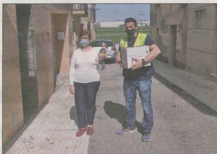
Ahir dissabte ja es van començar a entregar

L'Ajuntament de Torre-serona un ou de Pasqua decorat amb una felicitació per totes les cases del municipi. Per segon any consecutiu, la celebració de la mona queda relegada a la mínima interacció social. És per això que des del consistori han apostat per fer aquesta acció per "aixecar una mica els ànims" en un context de restriccions i limitacions.