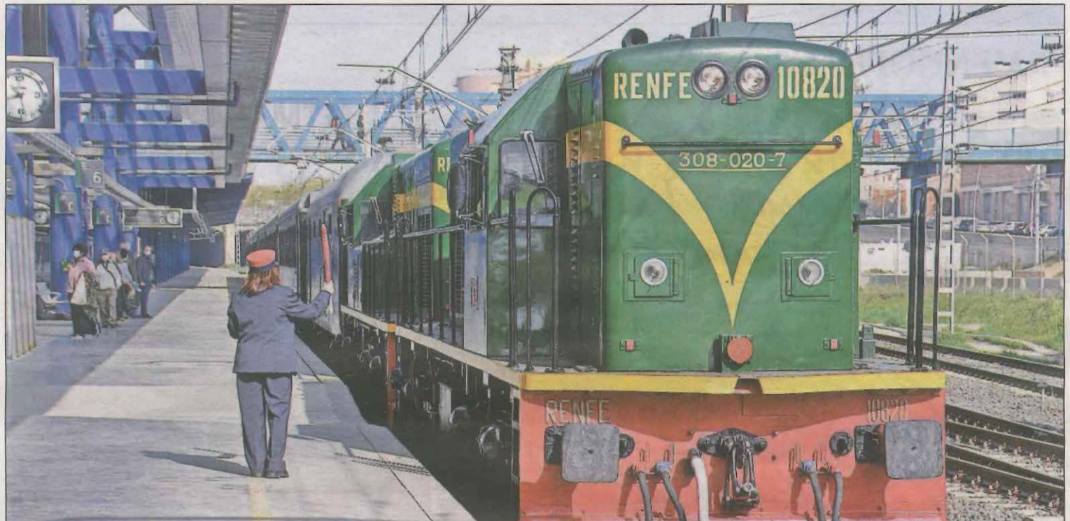
Alguns dels passatgers que ahir van decidir pujar al tren, que circularà tots els dissabtes fins al proper 30 d'octubre