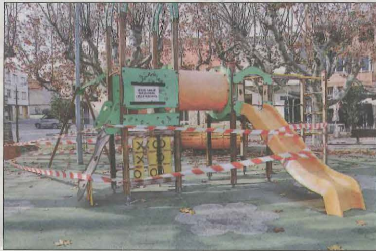
Parc infantil precintat a Linyola el passat mes de desembre

La Noguera en té 18, el 60% dels municipis de la comarca): Àger, Algerri, Alòs de Balaguer, les Avellaneres i Santa Linya, la Ba-