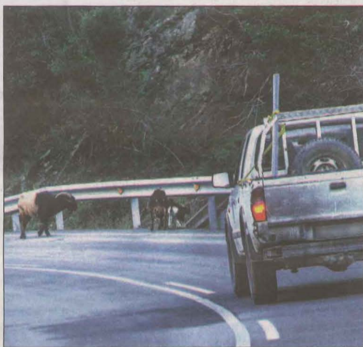
Un vehicle aturat mentre dues cabres llepen sal

El tram de la carretera C-13 entre Llavorsí i Rialp és on es concentra la població més important d'aquests animals, tot i que també se'n troba en altres trams de via com el que hi ha entre Llavorsí i Esterrí d'Àneu. Aquesta pràctica es portarà a terme durant tot l'any i així es pretén acostumar a les cabres a anar a buscar la sal en un altre indret i a l'hivern vinent evitar que tornin a baixar a la car-