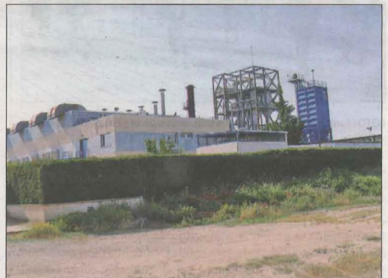
Imatge d'arxiu de la planta de Tracjusa, situada a Juneda