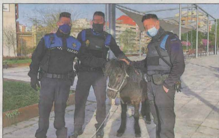
Tres agents, con el animal en el Parc de les Vies

Urbanos y Mossos interceptaron ayer un poni que paseaba suelto por Lleida. Fue retenido en el Parc de les Vies tras pasar por Rovira Roure, Onze de Setembre y Plaça Europa. Se investiga su procedencia. LOCAL | PÁG. 12