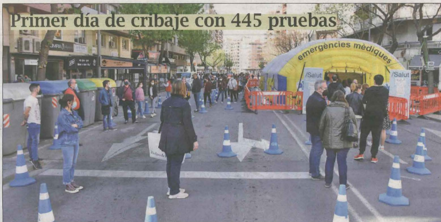
Largas colas ayer en la carpa instalada en Rovira Roure

Expectación en las calles de Lleida por un poni que paseaba suelto