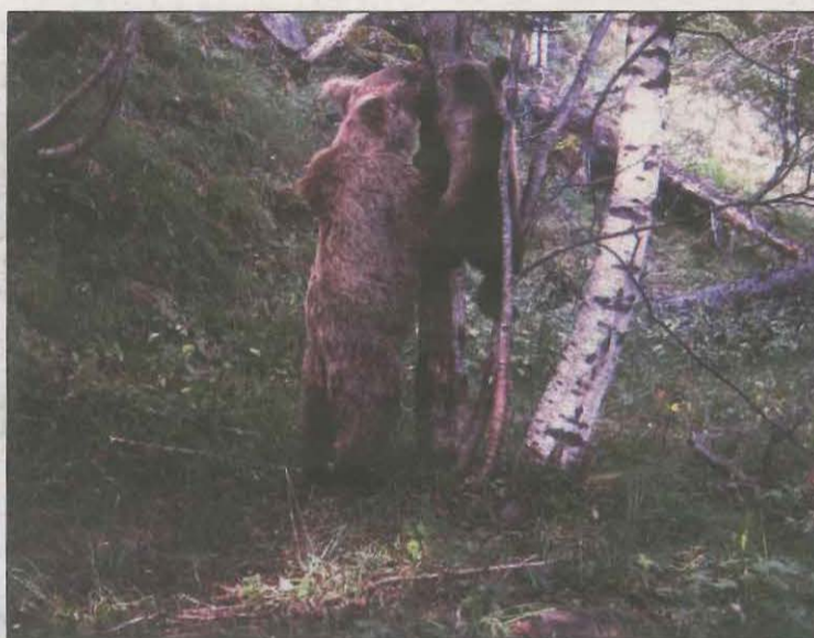
Una ossa amb cadells en el seu habitat natural

morts o desapareguts nou exemplars. Es donen per desapareguts o morts aquells dels que no es tenen indicis després de dos anys o es té constància de la seva mort. Entre aquests, es comptabilitzen les morts causades per l'home de l'ossa Sarousse, el mascle Cachou