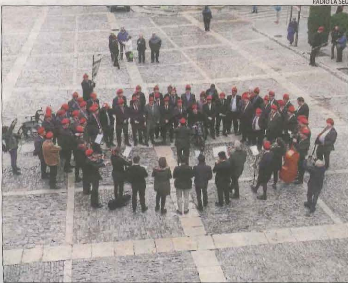
Última edició de les caramelles a la Seu d'Urgell, el 2019.

LA SEU D'URGELL | Els carrers de la Seu d'Urgell i Castellciutat no podran disfrutar per segon any consecutiu de les tradicionals caramelles. Per aquesta raó, els tres cors caramellaires han organitzat una cantada en format audiovisual. D'aquesta forma, les Caramelles Infantils, integrades per alumnes dels grups de cant coral de l'Escola Municipal de Música (EMM) i l'alumnat de cinquè de Primària dels col·legis Mossèn Albert Vives, Pau Claris i La Salle, han preparat quatre peces, una per part de cada centre educatiu, que compten amb l'acompanyament instru-