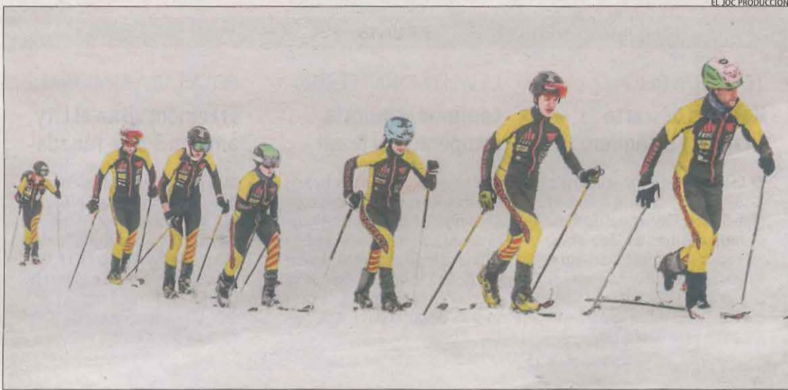
Part del grup d'esquiadors del CTEM seguint les indicacions dels tècnics.