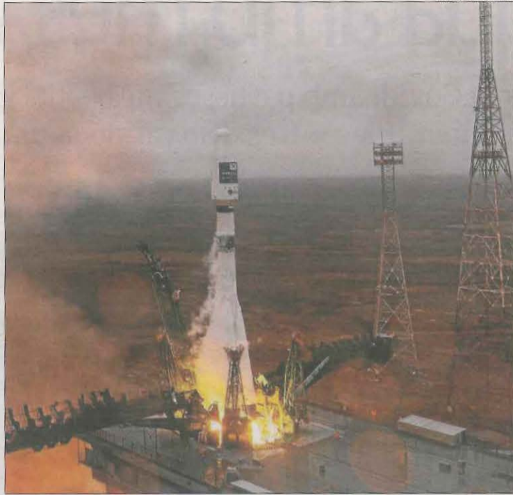
Llançament el passat 22 de març del nanosatèl·lit Enxaneta.