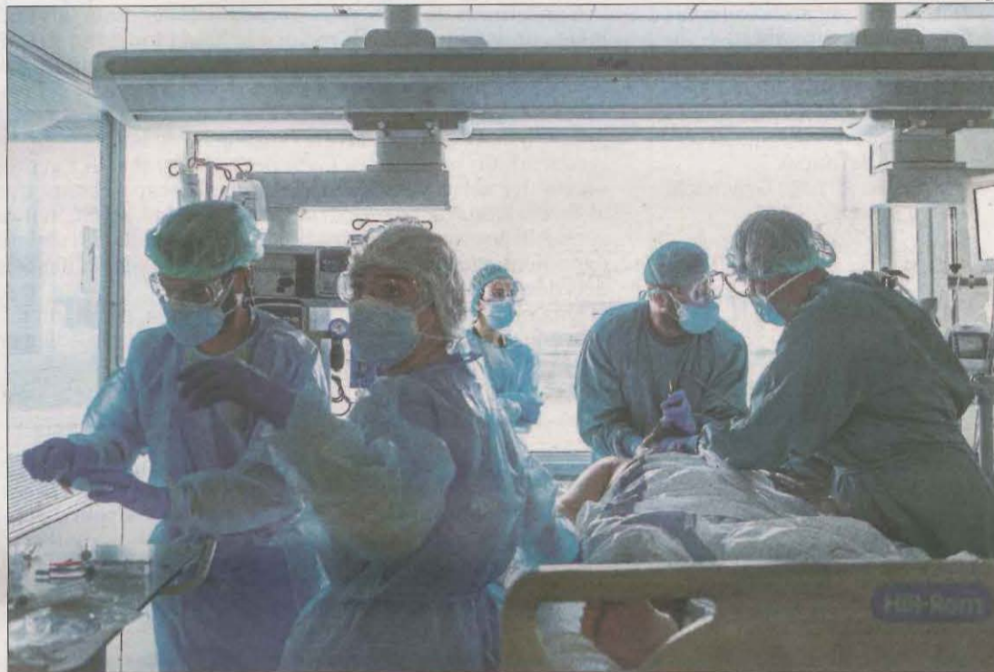
Un pacient a l'UCI de l'Hospital Universitari de Bellvitge per a pacients Covid.

centatge de positius en proves PCR i tests d'antígens, se situa en 5,50%, per sobre del 5% que l'OMS assenyala com a llindar de control de l'epidèmia.