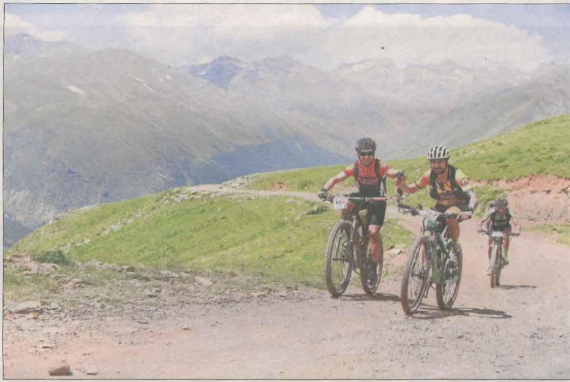
La Pedals de Foc destaca, a part de per la duresa, per la bellesa paisatgística.

La prova té un recorregut de 213 quilòmetres, amb 6.200 metres de desnivell positiu. La ruta, amb sortida i arribada a Vil·la, tindrà el tradicional itine-