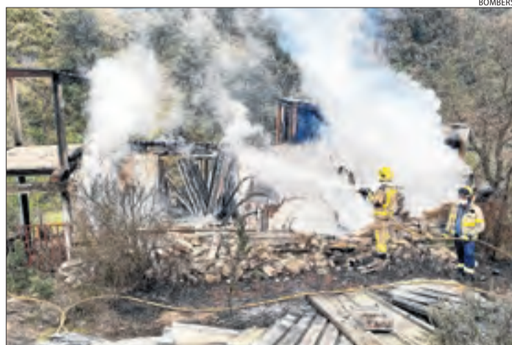
El foc es va declarar a les 12.40 hores a Llordà.