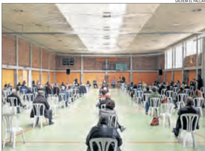
El públic que va assistir a la jornada celebrada a Isona.