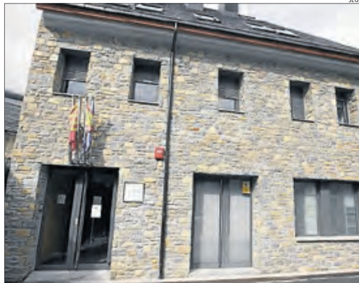
Imatge dels jutjats de Vielha.

Els investigadors han decomissat fins al moment 1.879 grams de cocaïna en els escorcolls practicats en habitatges dels suposats membres de la xarxa, segons van informar fonts properes al cas a aquest diari. A més, entre la substància estupefaent, hi havia preparades 249 paperines presumptament per distribuir-les a la Val d'Aran durant la Setmana Santa, segons van indicar les mateixes fonts. L'organització, entre les quals hi ha persones de nacionalitat colombiana, tenia la seu a Vielha i ramificacions a la ciutat de Lleida i les localitats castellonenques de Vila-real i Almassora.