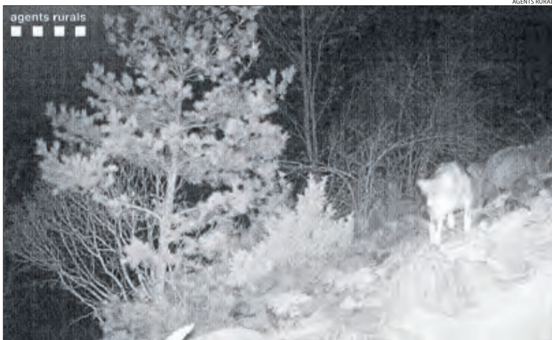
Una de les imatges captades per una trampa fotogràfica dels Agents Rurals a la Vall de Boí.

Per ara es desconeix si l'animal fotografiat és un llop albirat anteriorment a la Ribagorça aragonesa o un nou exemplar. No hi ha hagut nous albiraments des de la imatge que es va fer al febrer. Tanmateix, el president de l'associació de ra-