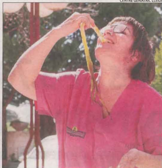
CENTRE GERIÀTRIC LLEIDA