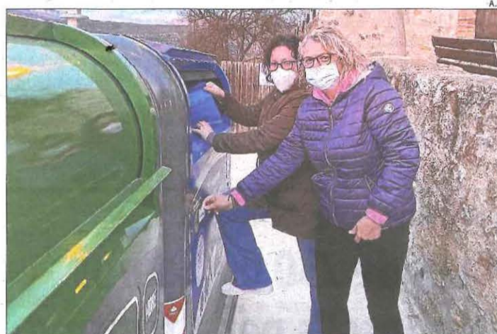
Primers usuaris dels nous dipòsits amb targeta.