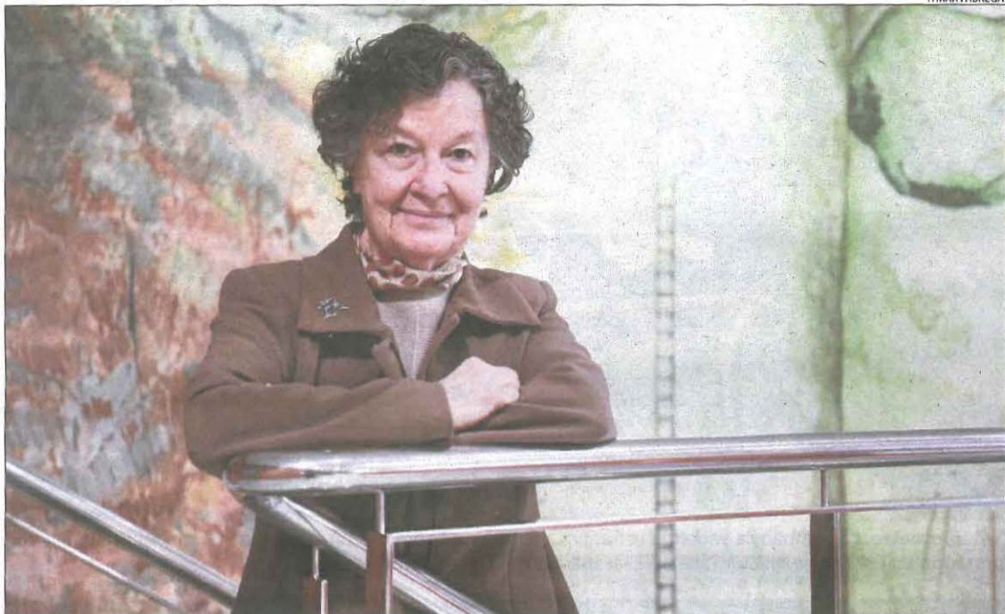
Maria Barbal va ser ahir a Lleida presentant la novel·la 'Tàndem'.

LLEIDA | L'any 2021 "ha començat extraordinàriament bé", reconeix Maria Barbal (Trep, 1949). Els Reis van ser generosos amb l'escriptora i la seua novel·la Tàndem (Destino) va ser guardonada amb el premi Josep Pla el 6 de gener. Fa una setmana, en plena promoció del llibre, va rebre el Premi d'Honor de les Lletres Catalanes que atorga Òmnium Cultural. "Encara estic digerint la notícia. Em sembla increïble formar part d'una llista en la qual hi ha noms que admiro tant com Mercè Rodoreda, Joan Triadó o Salvador Espriu." Un "vertigen" que se li passa quan retorna a Tàndem , un llibre vitalista en el qual una parella acabada de jubilar es retroba amb la vida. "L'Armand i l'Elena són una mica més joves que jo. M'interessava retratar aquest moment de crisi en què t'ho replantes tot perquè deixes enrere l'etapa laboral i, encara que disposes de més temps, això no significa tenir més llibertat perquè hi ha lligams." Barbal es posa en la pell d'Armand. Escriu la seua història en primera persona. "Va ser el personatge el que em va parlar i em va situar la història a Sants, encara que podria passar a Lleida, o en una altra ciutat." A Elena, en canvi, la llegim a través una veu