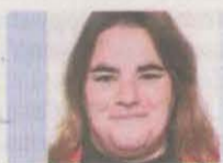
TXELL TERUEL EN COMÚ PODEM ALT PIRINEU I ARAN

L'"EQUITAT TERRITORIAL", defensada per molt poques forces polítiques, no és una expressió buida de sentit, sinó quelcom fonamental en territoris com l'Alt Pirineu i Aran, molt especialment en temes de sanitat i salut. Al nostre petit racó de món sabem què és tenir pocs recursos sanitaris i haver de fer molts quilòmetres per anar a fer-te proves o anar a una visita mèdica. La pandèmia de la Covid-19 ha fet encara més palesa la manca de recursos sanitaris i l'actual repunt dels casos a les comarques del Pallars Jussà i el Pallars Sobirà han posat al límit l'Hospital Comarcal de Tremp. I això no és com a conseqüència d'un repunt de centenars de casos, sinó tan sols de poc més d'una dotzena. Aquest és el retrat de la sanitat al Pirineu: precària, molt precària.