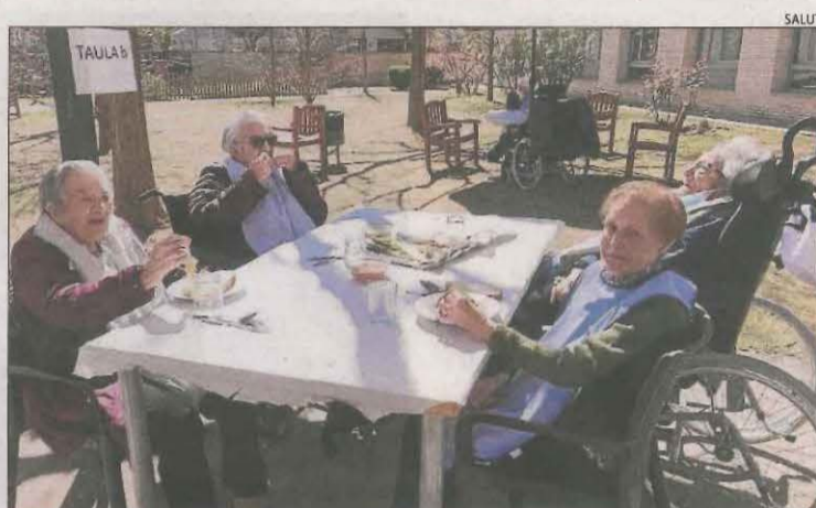
A la residència Balàfia I de Lleida també van fer una calçotada.