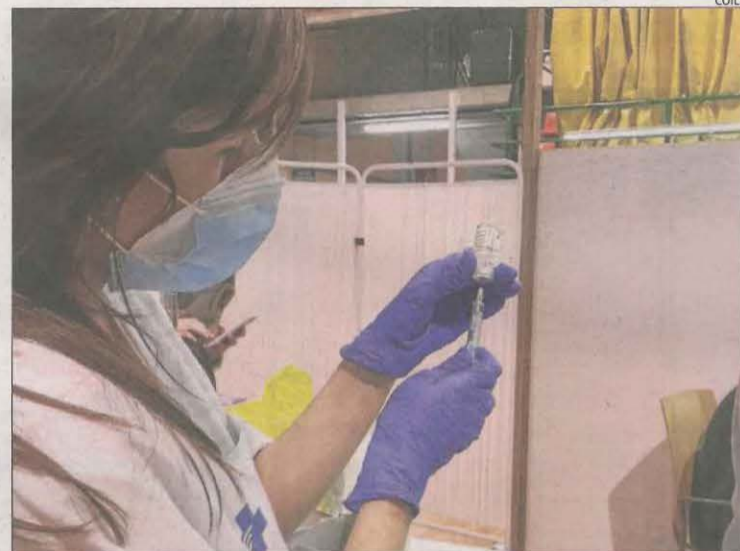
Imatge d'arxiu d'una infermera amb una dosi d'AstraZeneca.