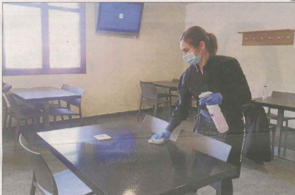
Imatge de preparatius a l'Hotel Port Ainé 2.000, que preveu obrir entre el dia 26 i el 4 d'abril.

Altres establiments esperaran fins a Setmana Santa. Aquest és el cas de l'Hotel Port Ainé 2.000, que obrirà entre el