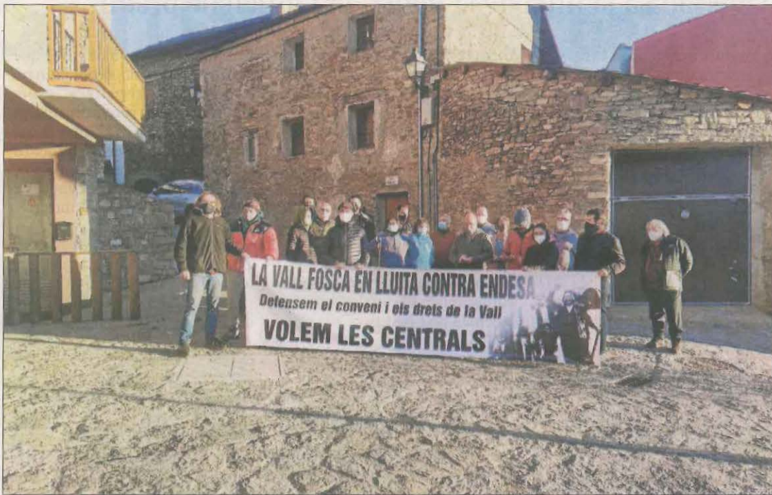
La concentració convocada ahir arran dels primers talls de llum al nucli de Pauils.

El primer tall va arribar dilluns i ahir ja n'hi havia sis. Fonts d'Endesa van indicar que seguiran en casos d'impagaments i que van negociar per evitar-ho. Precisament, empresa i ajuntament van pactar divendres el pagament de factures acumulades des del 2015. El consistori abonarà uns 300.000 euros pels seus rebuts i els veïns podran fraccionar els seus en 18 mesos sense interessos. Un tracte similar per a les factures entre el 2009 i el 2014 va posar fi als