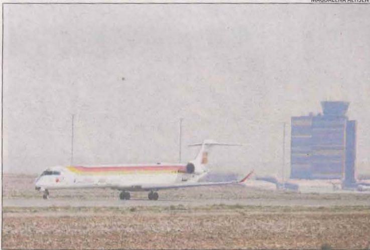
Un avió d'Air Nostrum a l'aeroport d'Alguaire.

La companyia aèria va confirmar que opta a ajuts i va apuntar que vol "continuar sent l'operador de referència a l'aeroport" lleidatà. De fet, és l'únic que opera vols de passatgers, amb l'excepció de xàrters ocasionals. Preservar la línia regular entre Lleida i Palma, amb Air Nostrum o amb una altra compa-