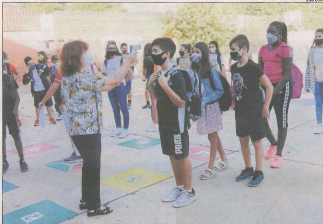
Les mesures de prevenció de la Covid han fet 'desaparèixer' la grip i la bronquiolitis.

A finals de desembre, metges de l'hospital Arnau de Vilanova ja van explicar que no hi havia casos de síndrome gripal com tampoc de la bronquiolitis, que sol afectar els nens.