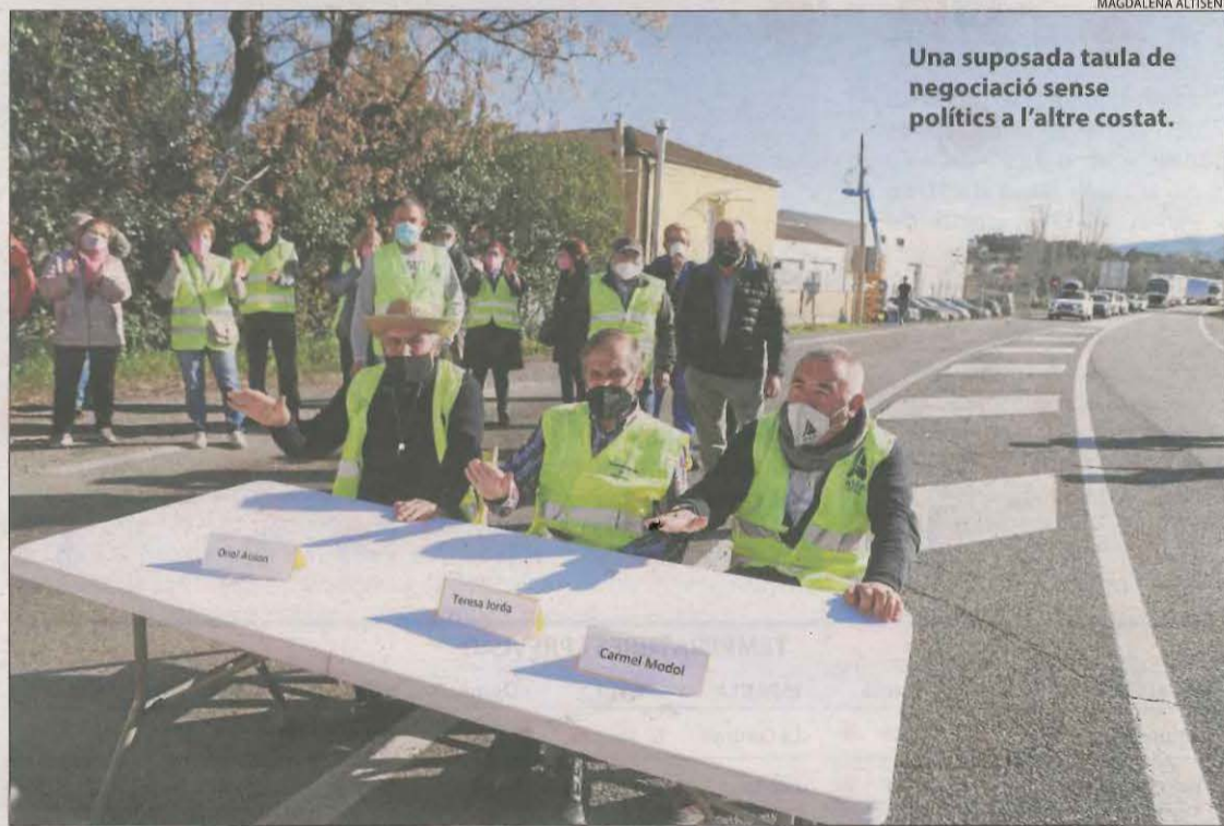
Una suposada taula de negociació sense polítics a l'altre costat.