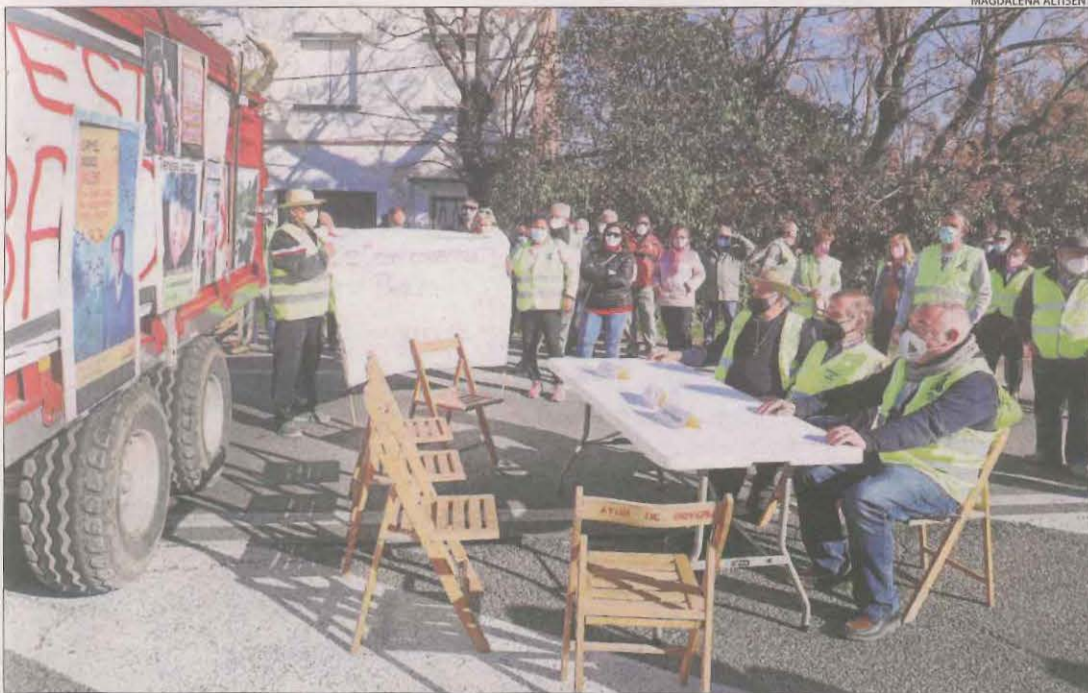
El tall de la C-12 amb una recreació de la taula sectorial de l'oli.