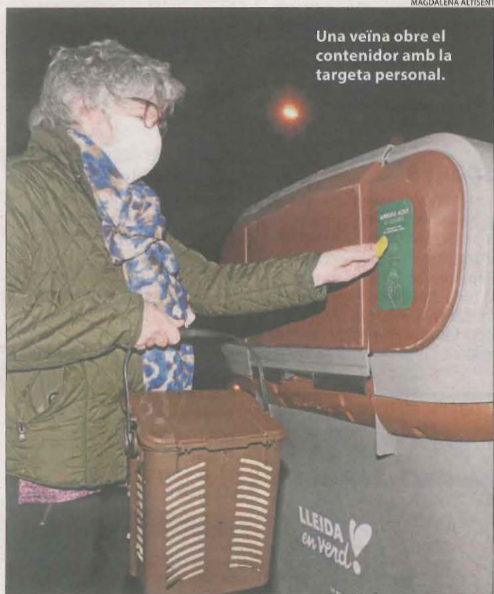
Una veïna obre el contenidor amb la targeta personal.