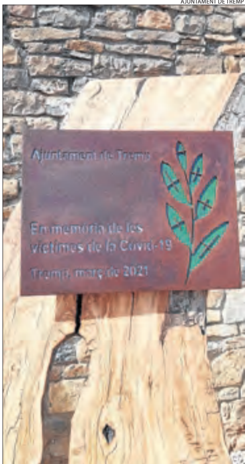
L'escultura en record dels morts per Covid-19 a Tremp.

Segons les últimes dades de la Generalitat, la Seu d'Urgell és l'únic municipi de l'Alt Urgell en què la velocitat de transmissió (Rt) del virus està per sobre d'1. Aquest índex se situa en 1,43, la qual cosa significa que cada cent contagiats transmeten el virus a una mitjana de 143 persones.