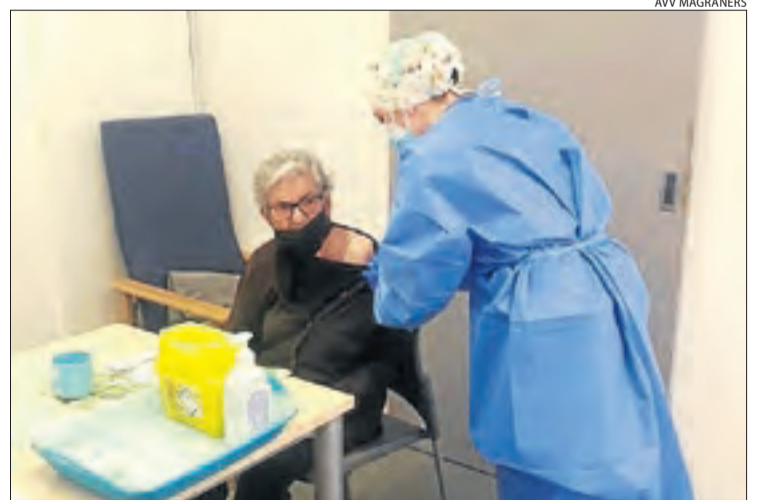
Una usuària del centre de dia de Magraners rep la vacuna.

I és que són moltes les persones, sobretot d'edat avançada i de risc, que estan preocupades o no entenen per què no se'ls està vacunant. Actualment, els CAP estan administrant les dosis de Pfizer i Moderna a grans dependents i a usuaris de centres de dia, així com a majors de vuitanta anys, tant si estan en un programa d'atenció domiciliària com no. Tanmateix, tal com ha explicat en nombroses ocasions el secretari de Salut Pública, Josep Maria Argimon,