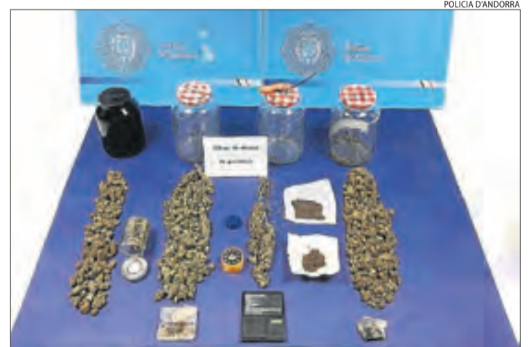
Marihuana i objectes decomissats per la policia d'Andorra.