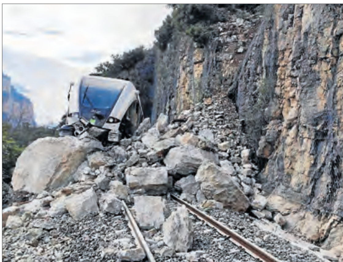
Imatge difosa a través de les xarxes socials del tren descarrilat després de xocar contra les roques.

inspeccionar ahir amb drons. El tren avariament i fora de les vies va quedar al lloc del sinistre, i no el retiraran fins que s'estabilitzi el talús. Així es pretén evitar que treballadors puguin resultar ferits si hi hagués més despreniments. Avui està previst iniciar treballs a la muntanya i es prolongaran durant tot el cap de setmana. Quan conclouguin, el comboi es traslladarà al Pla de Vilanova de Lleida per avaluar els danys i reparar-los. FGC ha sol·licitat per fer-ho l'assistència a Renfe, que disposa de personal i maquinària per retirar el comboi avariament.