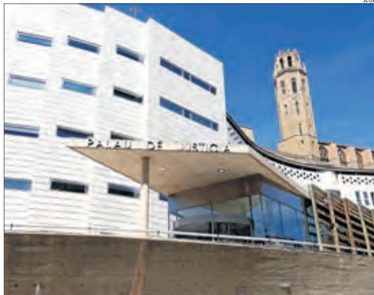
Vistes de l'edifici de l'Audiència de Lleida, al Canyeret.

Si es comparen les dades amb les d'exercicis anteriors, l'informe revela que l'estricta confinament domiciliari provocat per la pandèmia va invertir la tendència a l'alça registrada en l'activi-