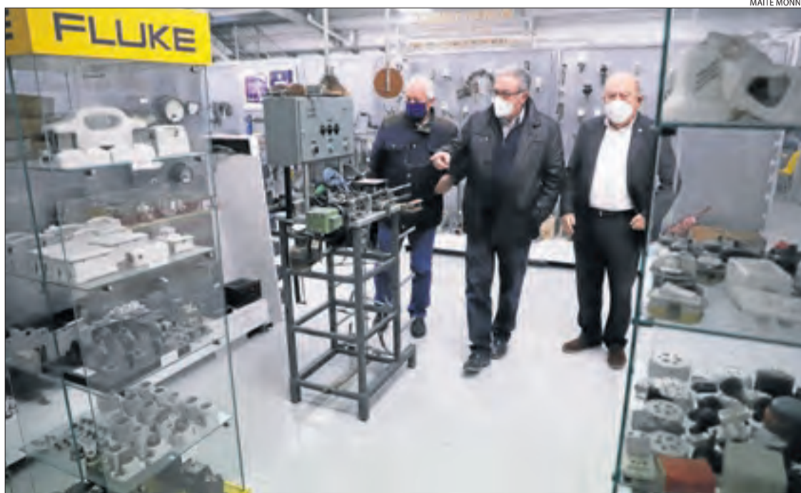
Membres de l'associació de jubilats del gremi d'instal·ladors, dimarts passat al museu.