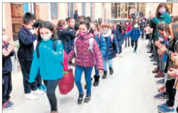
Benvinguda a Maristes. Alumnes del col·legi Maristes de Lleida, aplaudint una classe quan va tornar del confinament.

El nombre de grups confinats s'ha disparat a vuitanta-set, la qual cosa representa catorze més que el dia anterior i trenta-dos més que les dades de di-