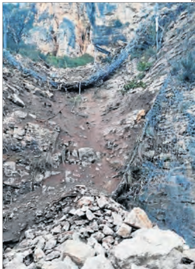
Les xarxes anti-allaus van cedir sota el pes de les roques.

En un altre ordre de coses, Renfe va fer la primera reunió del grup d'experts format per representants de diferents sectors socials i econòmics de la societat catalana. L'operadora va indicar que aquest ens consultiu haurà d'assessorar-la sobre el seu "creixement a Catalunya".