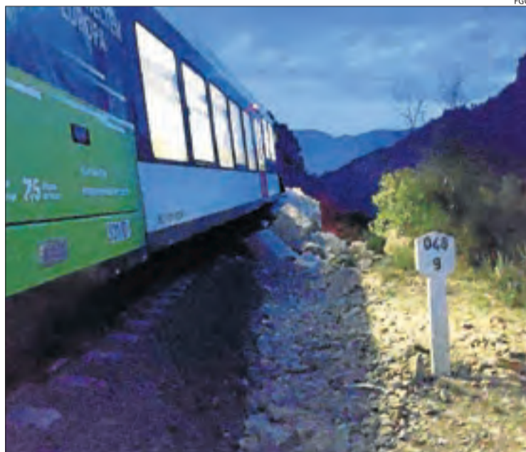
El tren va descarrilar a primera hora del matí.

L'operadora estatal va enviar ahir dos tècnics per avaluar la situació. També es rehabilitarà la via, que no s'obrirà fins a completar una nova revisió del talús per garantir que estigui consolidat, segons FGC. L'empresa pública espera donar dilluns una estimació de terminis per restablir els trens.