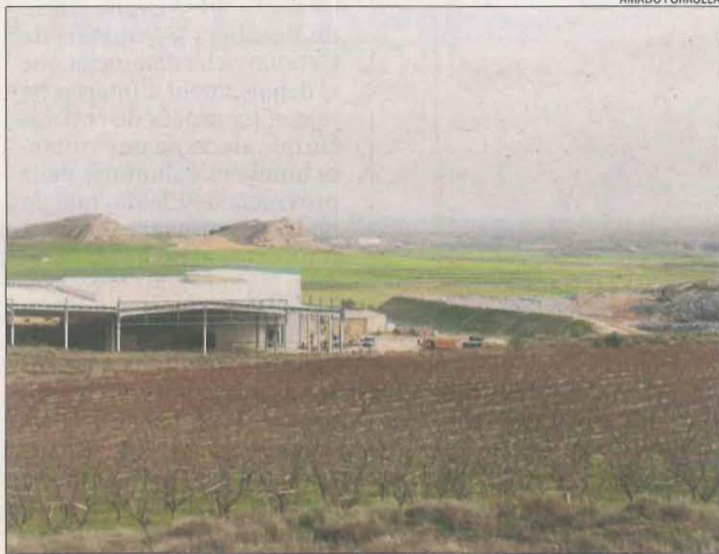
Les obres de la planta de reciclatge de l'abocador de Montoliu.

Els alcaldes de Seròs, Maials, la Granja d'Escarp i Almatret demanaran a la Generalitat una nova reunió urgent perquè els aclareixi en quin punt està el projecte i les previsions del Govern. Volen tenir temps per oposar-s'hi i recórrer a la Justícia perquè no passi com amb les obres de l'abocador de Riba-roja, de les quals es van assabentar quan ja no hi havia possibilitat de recursos.