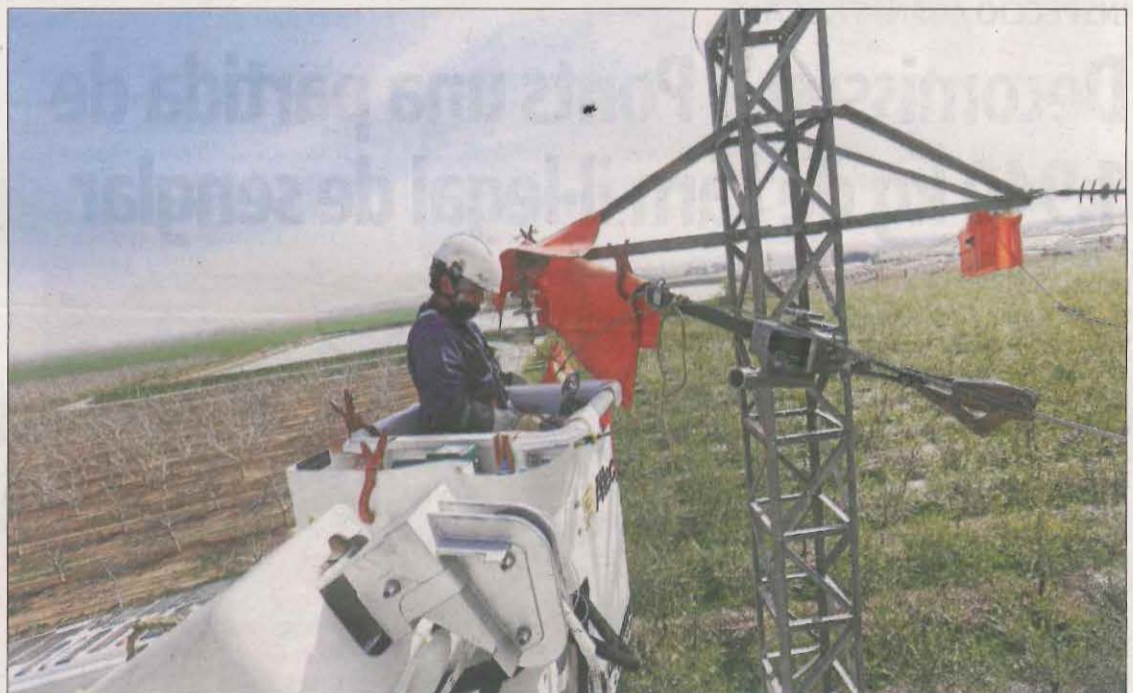
Treballs per instal·lar proteccions en una torre de Gimennells, on es van electrocutar dos aus el 2018.

ció de torres s'emmarquen, en part, en el conveni que Endesa va firmar l'agost passat amb les conselleries d'Agricultura i Territori per mitigar els riscos d'electrocució i col·lisió d'aus, sobretot de les espècies catalogades com a amenaçades.