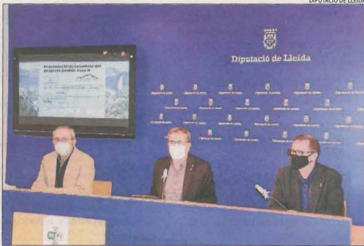
Presentació de la investigació a la Diputació de Lleida.

La investigació s'ha desenvolupat a partir d'una mostra