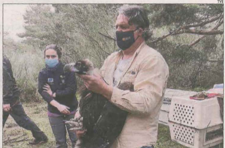
El programa s'interessa per l'evolució del voltor negre.