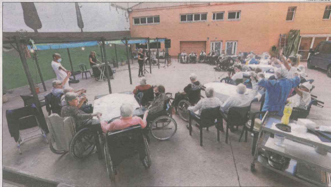
Imatge d'arxiu d'una activitat en una residència de Lleida el setembre passat.

amb 10, i les Garrigues i el Pallars Sobirà, amb 7. A la cua se situen Aran, amb 6 centenaris; el Solsonès, amb 4, i l'Alta Ribagorça, amb 1.