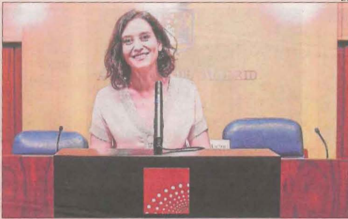
'La Sexta columna' analitza la situació política de Madrid ■ A Ayusazo, Antonio García Ferreras analitza a La Sexta les conseqüències en la política nacional del terratrèmol causat per la presidenta de Madrid, Isabel Ayuso, al convocar eleccions.