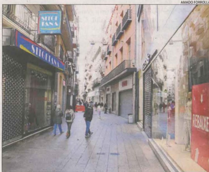
Comerços de l'Eix tancats un dissabte del gener passat.

LLEIDA | La patronal Pimec Comerç va anunciar ahir que dissabte els seus associats a tot Catalunya obriran dos hores els comerços associats a tall de protesta. Una acció que té com a objectiu reclamar a la Generalitat que suavitzí les restriccions que els aplica pel coronavirus i permeti als comerços no essencials obrir els caps de setmana, ja que des de principis d'any no poden obrir els dissabtes. La patronal mostra així el seu desacord amb les mesures del Govern, que qualifica d'"injustes", i afirma que no tenen en compte àmbits territorials "tan diferents com són Barcelona i Lleida o el Pirineu".