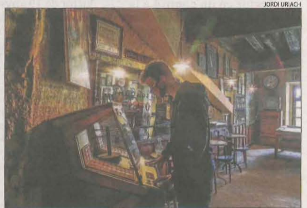
Imatges dels turistes als establiments.