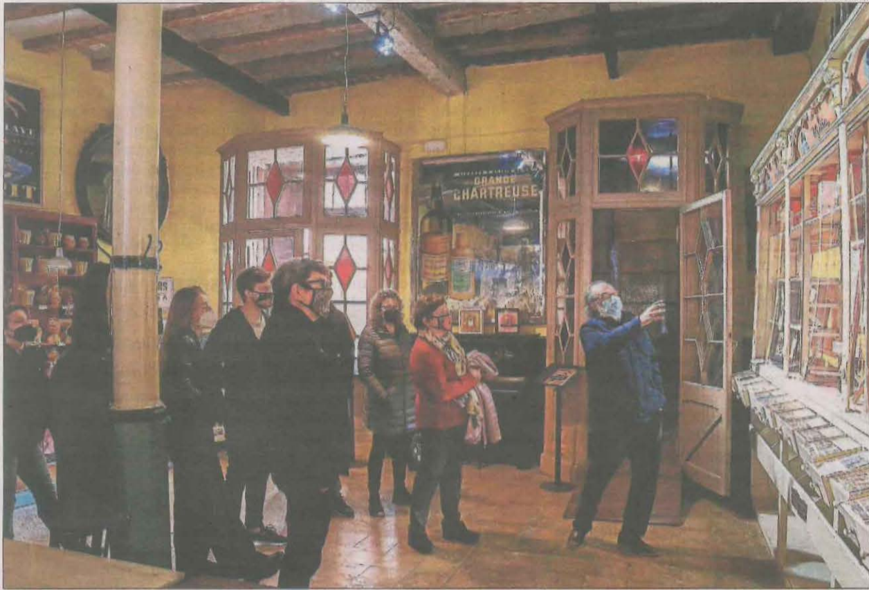
El primer grup de visitants de la temporada, ahir a les botigues museu de Salàs de Pallars.