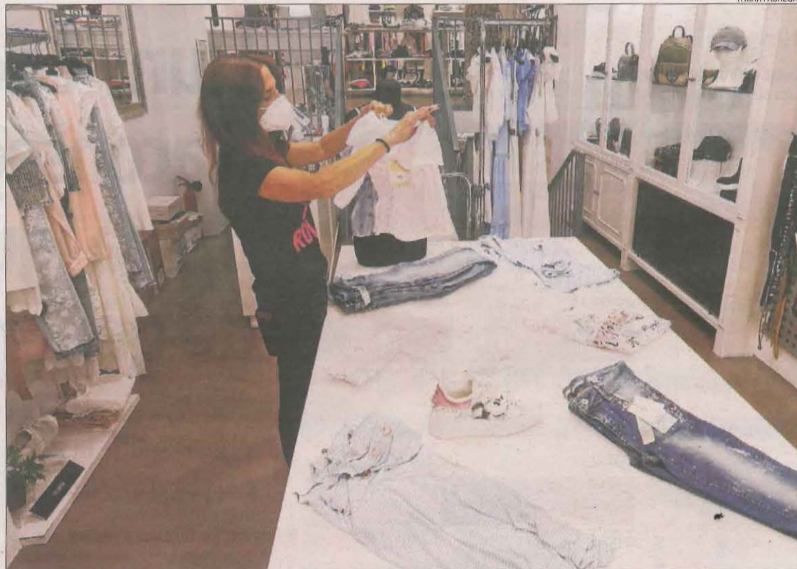
El comerç, amb l'hostaleria i el turisme, és un dels sectors amb més taxa d'ocupació femenina.

punts inferior a la dels homes, mentre que l'any 2019 era de set punts. Però la taxa d'atur de les dones era del 9,5%, gairebé tres punts per sota que la dels homes, una xifra positiva però que s'explica "pel creixement més elevat de la inactivitat de les dones o pel desistiment a incorporar-se al mercat laboral, potser per la Covid-19", segons CCOO.