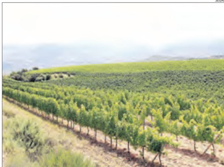
Vista general de vinyes a la zona de Tremp.