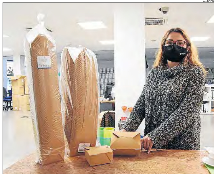
Es repartiran 5.500 envasos de cartró entre els restaurants.

■ Des de la Diputació van assenyalar la necessitat de tenir el pla d'usos de Mont-rebei, que contempla un informe geològic. Van afegir que ha de primar la seguretat de la zona per obrir i que es tracta d'una qüestió de responsabilitat.