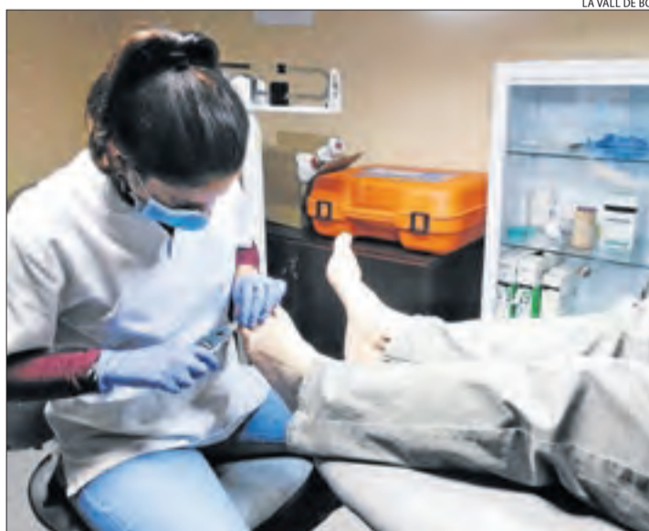
El servei de podologia ja funciona des de fa dos anys.

Amb aquesta iniciativa, el consistori vol evitar desplaçaments, sobretot de la gent gran i en la situació actual de tancament perimetral de la comarca per la pandèmia. Així doncs, una vegada detectades certes necessitats i a petició dels mateixos veïns, el consistori, amb