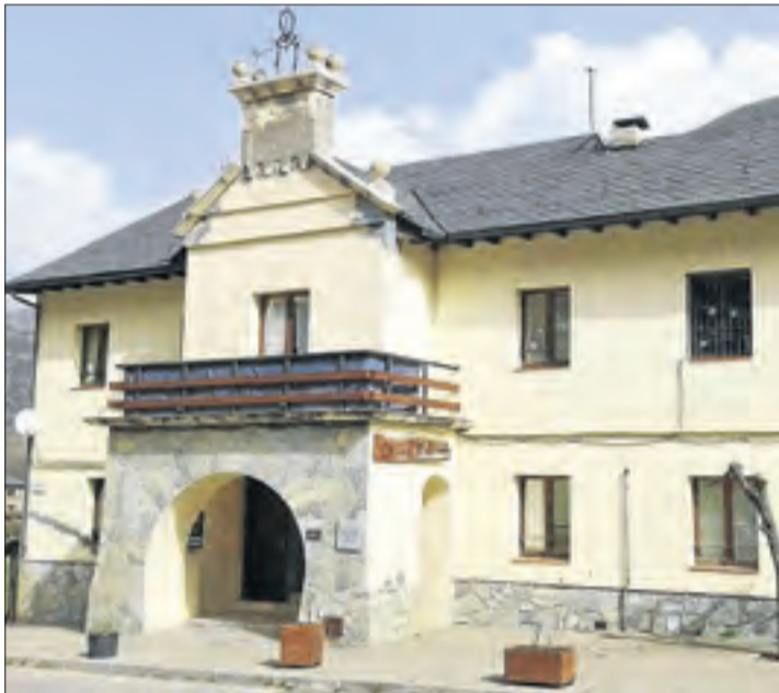
Escola Els Minairons, on projecten la guarderia.

RIBERA DE CARDÓS | Famílies dels municipis de Lladorre, Esterrí de Cardós i Ribera de Cardós han iniciat una recollida de firmes per demanar que l'escola pública Els Minairons, de Vall de Cardós, aculli una guarderia per a 5 alumnes de 0 a 3 anys. L'objectiu d'aquest col·lectiu és aconseguir que l'ajuntament atengui la petició i que sigui una realitat per al curs escolar que ve 2021-2022. Les famílies asseguren que la inici-