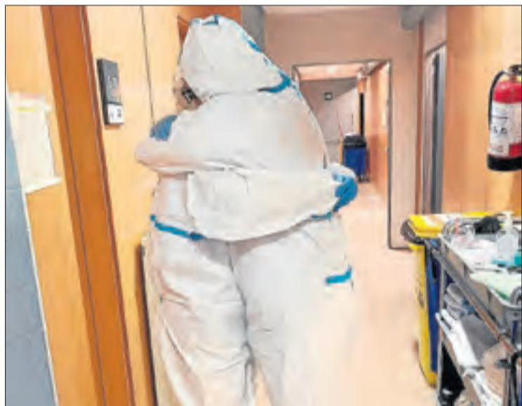
Dos empleades de la residència de Sant Josep de Lleida s'abracen.

■ Per a professionals dels col·lectius essencials (com ara coscos de seguretat, farmacèutics i docents) que siguin menors de 56 anys i que no tinguin cap patologia. A més, no han d'haver passat la Covid en els últims sis mesos.