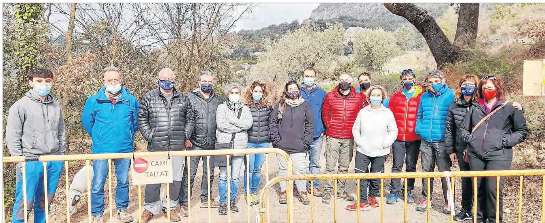
Empresaris de la Vall d'Àger temen que el congost continuï tancat durant mesos, la qual cosa afecta els seus negocis de turisme.

Empresaris de la Vall d'Àger es mostren preocupats per la paralització de les obres i la proximitat de Setmana Santa, cosa que pot agreujar la crisi || Lleida i Osca, pendents del pla d'usos d'aquest espai