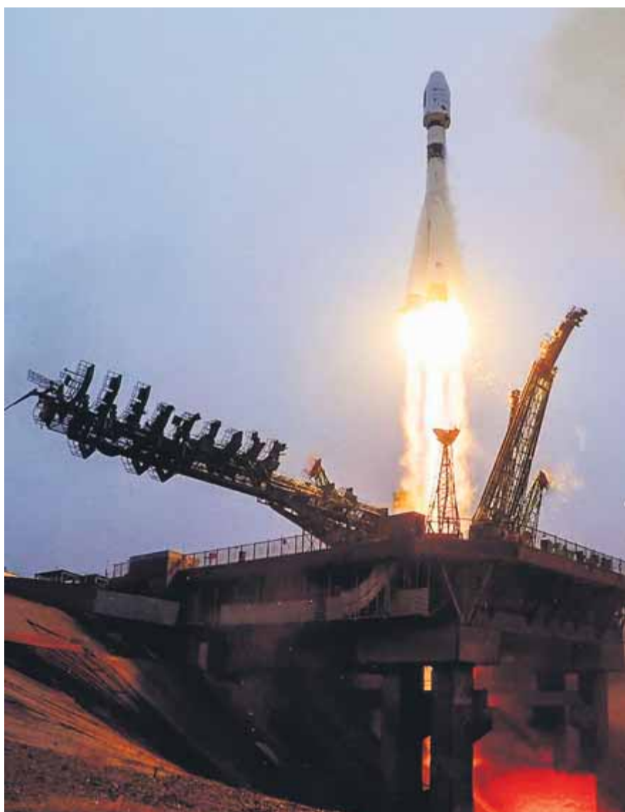
El coet Soyuz-2 enlairant-se ahir des del cosmòdrom de Baikonur ■ CENTRE ESPACIAL YUZHNY

Dijous, candidat i divendres, ple d'investidura