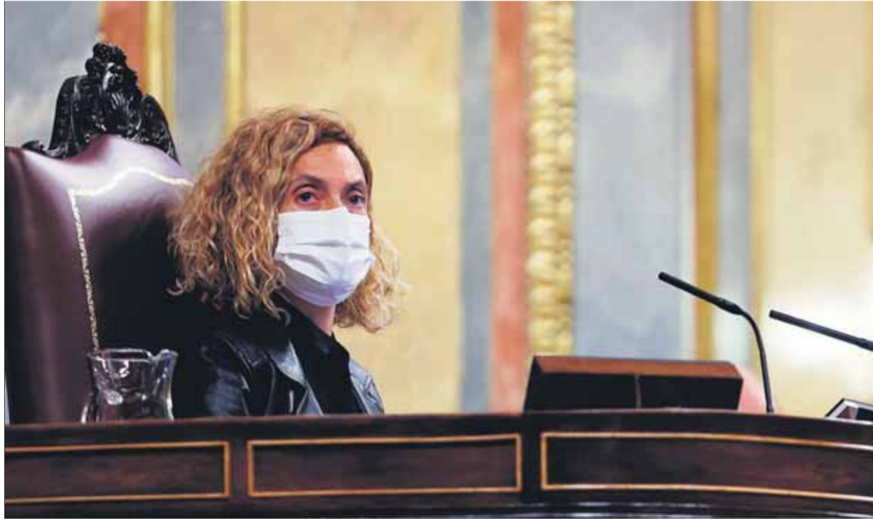
Meritxell Batet és la presidenta del Congrés i ha rebut l'argumentació dels lletrats per no qualificar la llei d'amnistia

La llei d'amnistia del 1977 va ser aprovada amb un suport gairebé total, del qual només se'n va apartar Alianza Popular, però era prèvia a la Constitució del