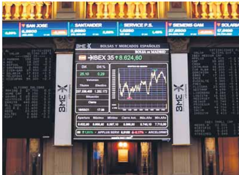
La borsa és un dels principals símbols econòmics de la nostra societat