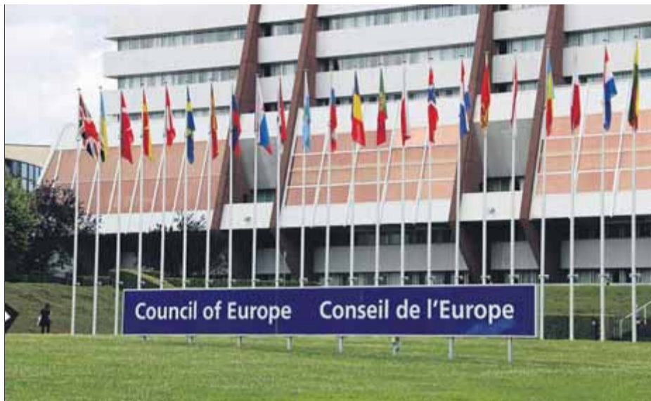
Exteriors el Consell d'Europa, da Estrasburg

Després de setmanes de protesta als carrers, la responsable de drets humans al Consell d'Europa, organització formada per 47 estats i vinculada al Tribunal Europeu de Drets Humans, va enviar una carta al govern de Pedro Sánchez el 11 de març passat per traslladar-li la seva preocupació per les "creixents condemnes" a