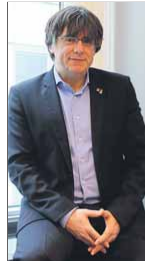
Carles Puigdemont, a Bèlgica ■ N.S.

lar: “Disposen per a això de la preeminència, dels mitjans i dels instruments que els proporciona el mateix marc constitucional per garantir l'autogovern de la seva comunitat, inclosa la disposició de quantitats rellevants de diners públics o fins i tot la disposició d'armes proporcionades a les seves forces de