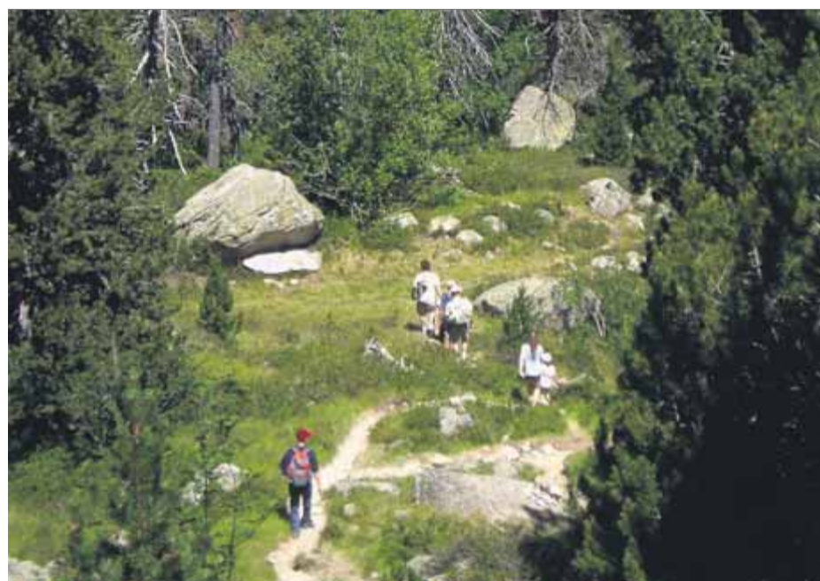
Excursionistes al camí de la Peüllà, on es vol ampliar l'estació, a l'estany Gerber

La zona coneguda com a central de Capdella i campament de Fecsa és al nord del nucli d'Espui, al municipi de Torre de Cabdella, a la vall Fosca. Els terrenys estan delimitats entre la carretera L-503 i el riu Flamisell. El campament de la central hidroelèctrica de Cabdella és un assentament industrial establert l'any 1912 a la vall que està declarat bé cultural d'interès local (BCIL) i inclou les edificacions originals d'aquella època. ■