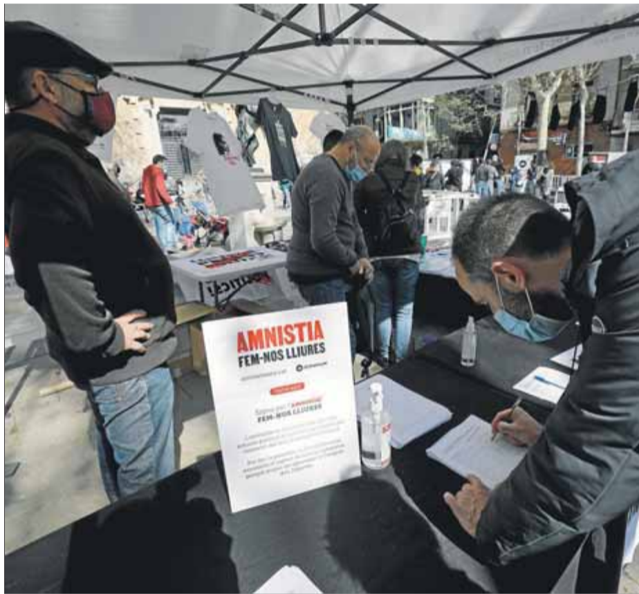
Un ciutadà signant ahir a Barcelona en la campanya per l'amnistia

Es podrà signar a favor de l'amnistia dels líders del procés en més de 500 localitats catalanes, entre elles Barcelona, Lleida, Manresa, Girona, Tarragona, Valls, Figueres, la Seu d'Urgell, Igualada, Reus, el Vendrell, Berga, Palafròlles, Tremp, Mataró, Ripoll i Sort. En algun d'aquests municipis ahir també s'havien organitzat actuacions musicals, activitats familiars, juvenils i infantils i performances artístiques. Al punt de votació de la plaça de la Virreina de la capital catalana, Mauri va recordar ahir que "la repressió de l'Estat no s'atu-