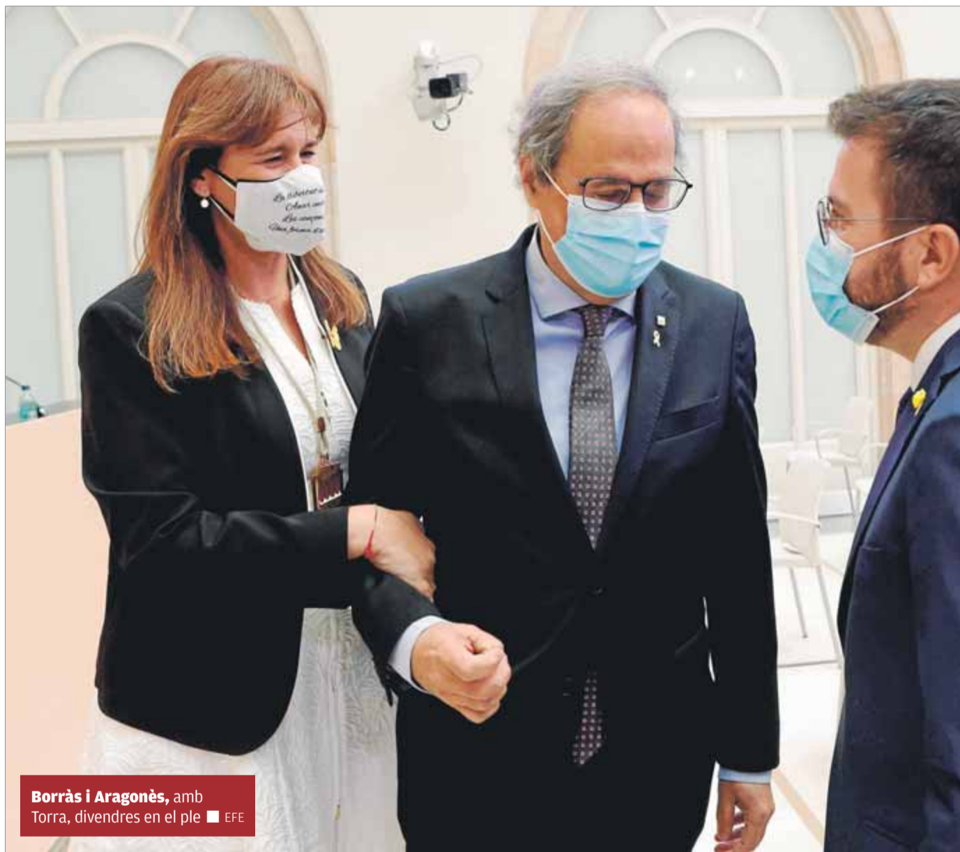
Borràs i Aragonès, amb Torra, divendres en el ple

Finalment, JxCat afronta la tasca de tancar un acord de govern enmig