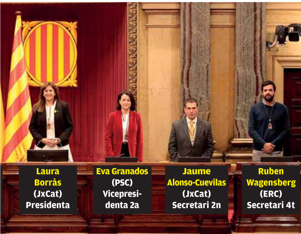
Laura Borràs (JxCat) Presidenta