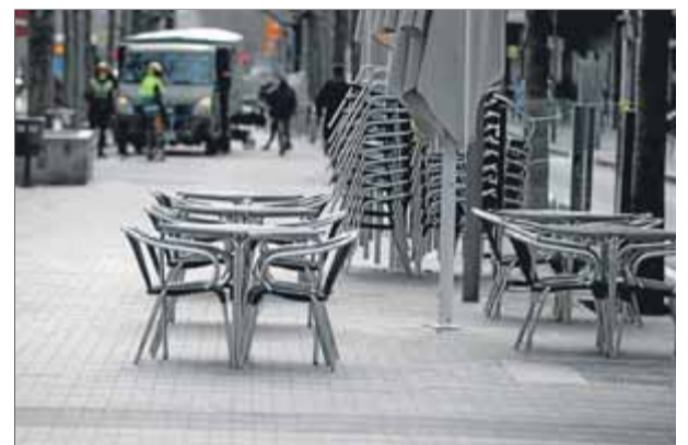
Taules buides, malgrat l'obertura de la restauració, en un carrer de Barcelona