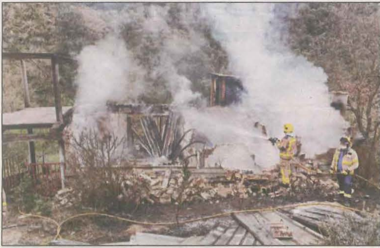
Els Bombers van extingir l'incendi de Llordà