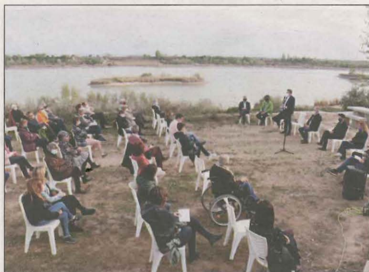
Imatge de la presentació d'ahir a Cal Sinén

El grup de Junts per la Vall de Boí va demanar en el darrer ple municipal una millora urgent del ferm de la carretera L-500, que consideren que no dona imatge i que afecta a la seguretat dels conductors i també va reclamar actuacions al carrer Pradet i que les parades de bus tinguin caseta.