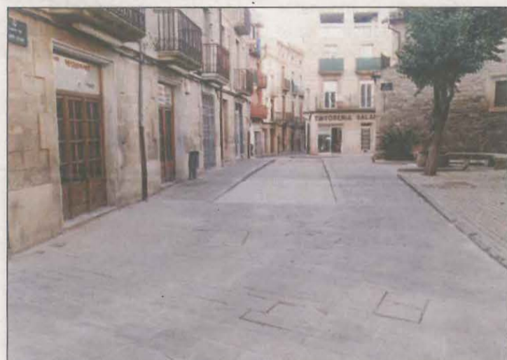
El trànsit estarà un mes tallat en aquests carrers

Les guspies d'un cable de la façana de l'Hotel Cal Joan del Batlle, a la Coma i la Pedra, van provocar l'incendi de 450 m2 de vegetació. L'incident es va produir al punt quilomètric 34 de la C-462. Els serveis d'emergència van rebre l'avís a les 8.57 hores i al lloc dels fets es van desplaçar tres dotacions, que van estar una hora per apagar les flames. No hi va haver ferits.