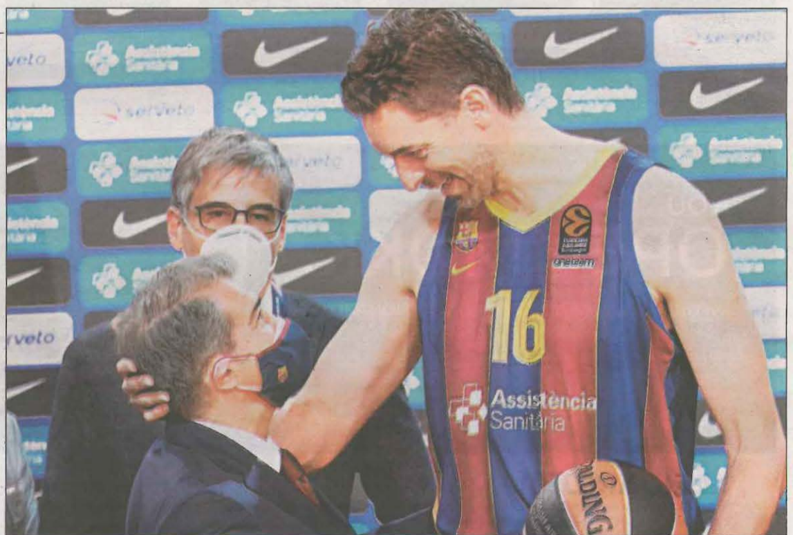
El de Sant Boi, con la camiseta blaugrana, saluda al presidente Joan Laporta

a un equipo en un gran momento y quiero ganar la Euroliga que me falta", destacó el pívot de Sant Boi, que no cerró la puerta a seguir después de los Juegos Olímpicos. El Barça juega hoy contra el Alba de Berlín en la Euroliga (21h) todavía sin Pau y con la idea de sellar el factor campo.