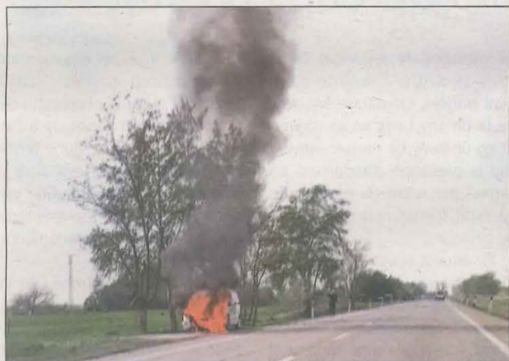
Moment en què s'estava cremant a la carretera

Els Mossos d'Esquadra van dur a terme ahir de matinada un operatiu policial antidroga per delictes contra la salut pública a la localitat de Vielha i altres municipis propers. En aquest sentit, segons van indicar fonts properes al cas, els agents del cos la policia catalana havia fet diverses detencions en el citat terme municipal, tot i que al tancament d'aquesta edició encara no havia transcendit el nombre d'arrestat, ni la seva edat ni veïnatge. Així mateix, també van assenyalar que els detinguts passarien a disposició judicial demà, raó per la qual el jutge haurà de determinar si queden en llibertat provisional o entren a presó. Per la seva part, fonts dels Mossos d'Esquadra van apuntar que es tracta d'un operatiu que va ser dirigit per l'Àrea d'Investigació Criminal de la policia catalana i que en aquests moments la investigació relacionada amb aquest cas continua oberta.