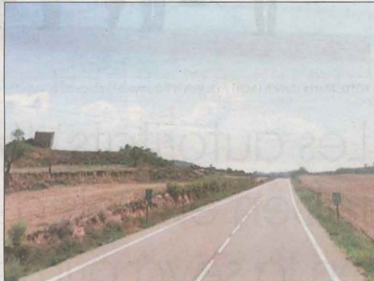
Imatge del tram on es va produir l'accident de Sanaüja

A les 9.58 hores els Mossos d'Esquadra van ser alertats d'un accident entre una moto i un tractor al punt quilomètric 118 de la C-53, en sentit Tornabus, al terme municipal d'Anglesola. Segons va explicar el Servei Català de Trànsit (SCT), per causes que s'investiguen es va produir una col·lisió per envestida entre els dos vehicles. Arran del xoc va morir el motorista, J. A. V. S., de 54