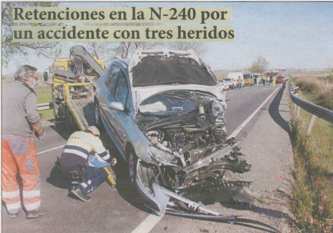
Un camión y dos turismos chocaron en el término municipal de Lleida LOCAL | PÁG. 12

La variante de Artesa hacia Comiols se comenzará a construir en verano pese a la oposición del comercio