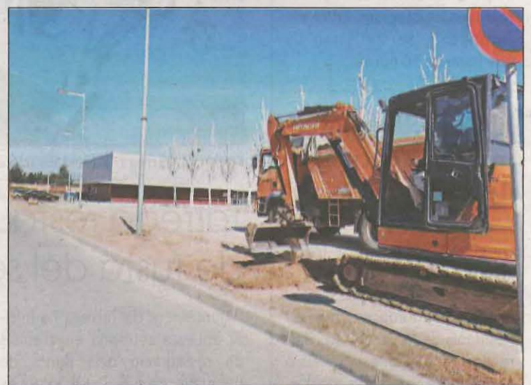
El termini d'execució de les obres és de tres mesos

D'altra banda, també han començat les obres d'arranjament de la plaça dels blocs de la Caixa. L'actuació a la plaça dels blocs de la Caixa, amb un pressupost de 65.385 euros, consistirà en l'enderrocament de l'actual banc de formigó així com del mur de contenció i l'enjardinament de la zona amb l'objectiu de crear una plaça d'un únic nivell.