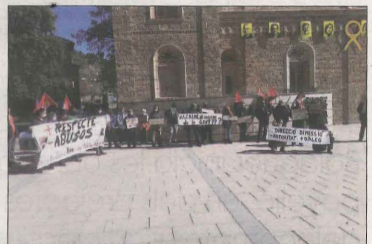
Ahir es van tornar a concentrar per rebutjar el calendari

d'aquests elements situats en diferents barris de la ciutat i en quatre pobles del terme: Altet, la Figuerosa, Claravalls i Santa Maria de Montmagastrell.