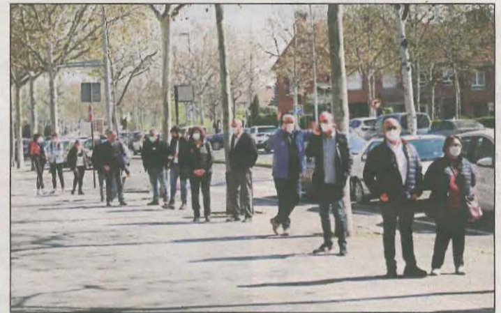
Un grupo de personas en el exterior del Onze de Setembre