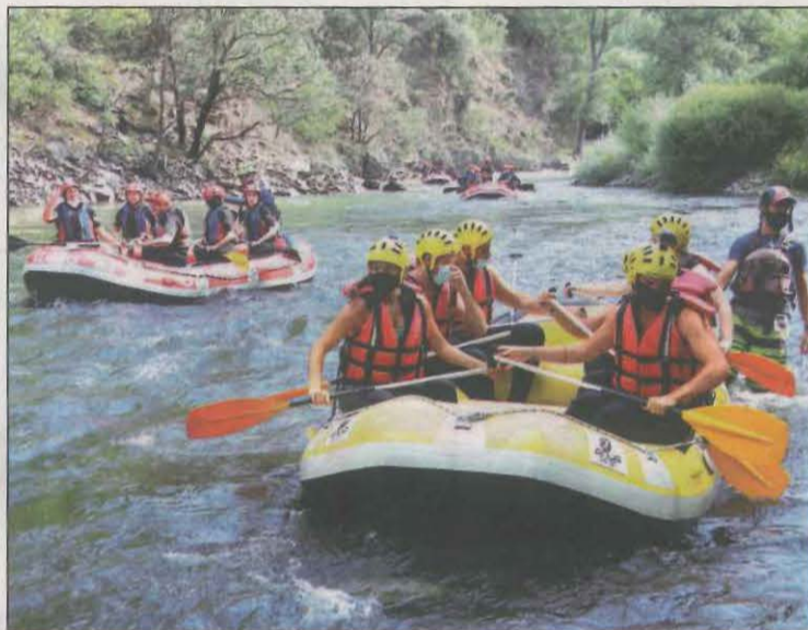
Imatge d'arxiu de barques fent ràfting al Pallaresa