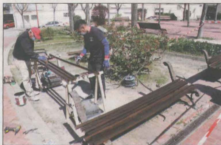
La restauració es du a terme de forma artesanal

Per sectors, l'ocupació als establiments d'hoteleria al Pirineu des del Dijous Sant fins al dilluns de Pasqua serà d'un 85 a un 90 % i sobre el 40 % en el primer tram de la setmana. A la resta de la demarcació, serà inferior. Es preveu que un 90 % dels establiments d'hoteleria del Pirineu estiguin oberts per Setmana Santa. Per la seva banda, les cases de turisme rural preveu una ocupació alta en el conjunt de la demarcació, si bé les limitacions imposades per les bombolles de convivència faran que molts d'aquests establiments estiguin plens però amb un menor nombre de clients.