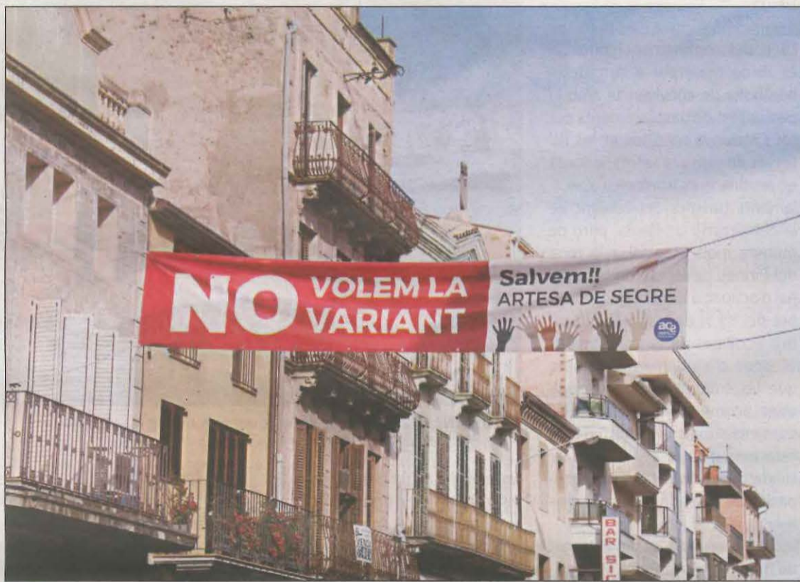
FOTO: No volem la variant/ L'obra es farà tot i el rebuig de comerços i serveis del municipi

En el seu recorregut, compartirà amb enllaços a nivell als seus extrems, al sud amb la carretera C-14 i al nord amb l'L-512, amb un carril central addicional per