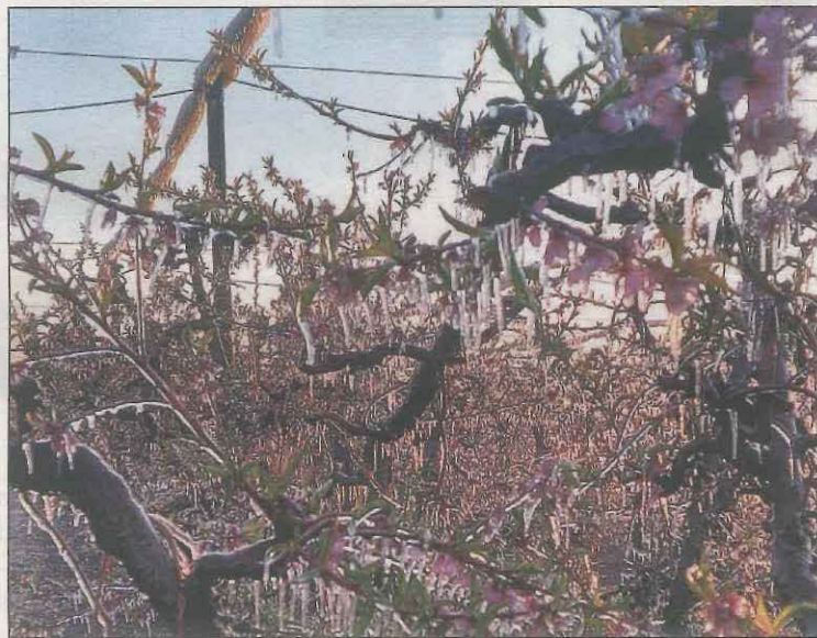
Imatge d'arbres fruiters afectats per les gelades