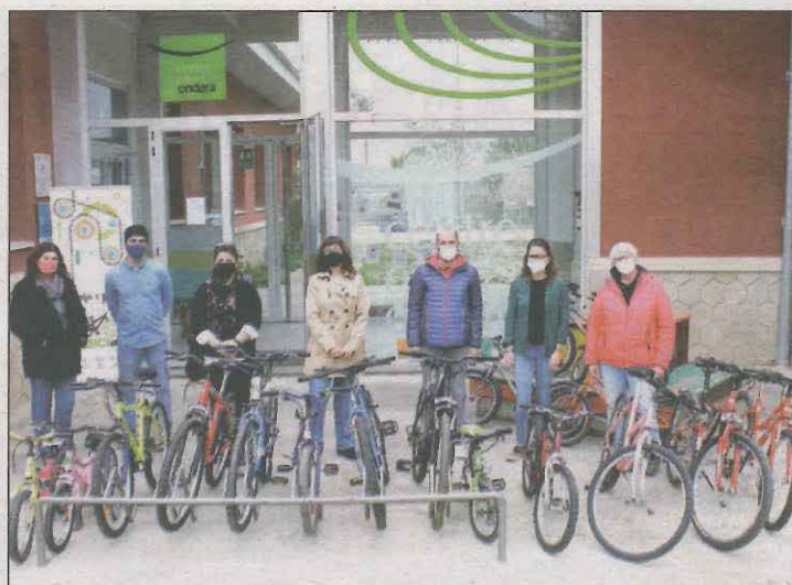
Imatge de la donació de bicicletes l'any passat

Tàrrrega un lot de 18 bicicletes recuperades. L'establiment Bici 3.0, situat al carrer del canal d'Urgell, 6) és el punt de recollida dels cascs, per a infants de 3 a 15 anys d'edat. La campanya, expliquen els impulsors, té l'objectiu de potenciar la pràctica de l'esport i el lleure entre els infants i joves del SIS Tàrrrega i també fomentar la reutilització.