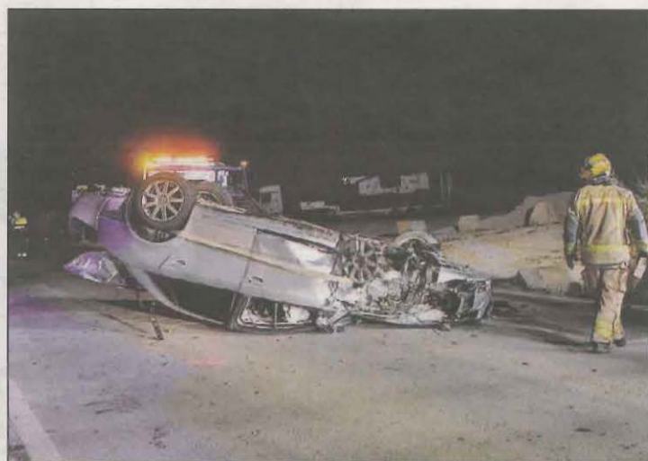
Imatge del cotxe bolcat en el sinistre d'Alcarràs

La reparcel·lació del projecte ja es va fer fa uns mesos, quedant pendent la urbanització amb els serveis i la posterior arribada de les empreses. Durant un més, les diferents administracions, com ara l'ACA o Carreteres, entre d'altres, podran presentar les seves al·legacions en poder revisar el projecte i si no hi ha cap es durà a terme el projecte definitiu. "Cal dir que diverses empreses ja ens han comunicat que volem instal·lar la seva seu productiva en el Polígon Industrial Les Agudes i això és una molt bona notícia per Ponts", va afegir.