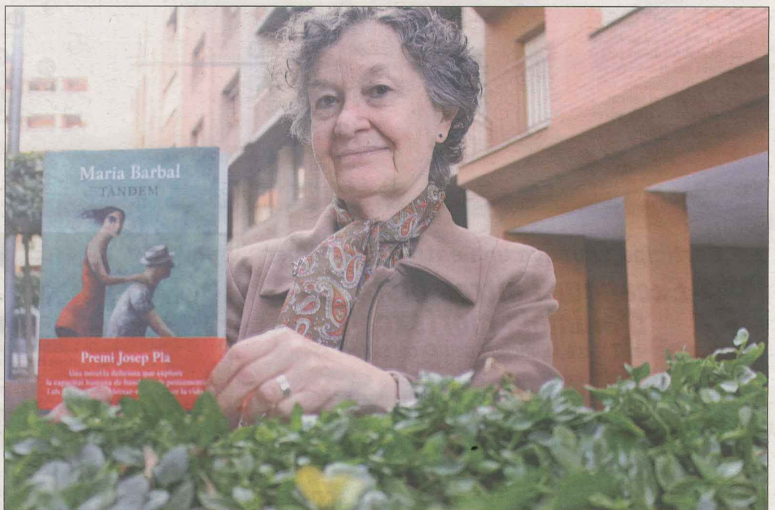
L'autora, acompanyada de de la seva obra, en una visita recent a Lleida per promoure el llibre ‘Tàndem’

Barbal exposa en el llibre com la nostàlgia que sent l’Elena per la seva feina —ha estat parvulista