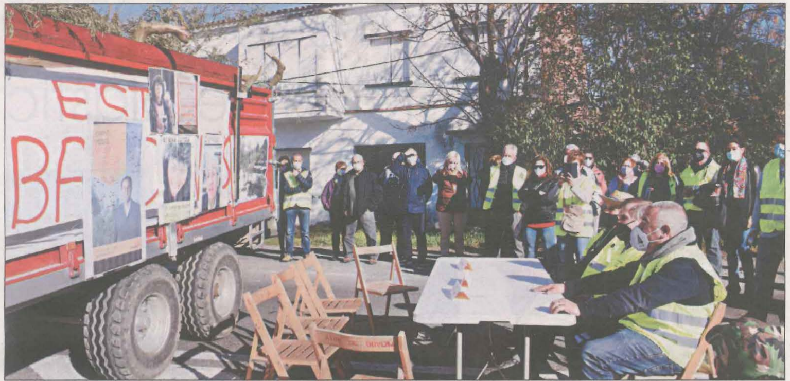
Convocats per Asaja i l'Ajuntament de Bovera, ahir es va escenificar una reunió de la Taula Sectorial que s'ha aplaçat dos cops