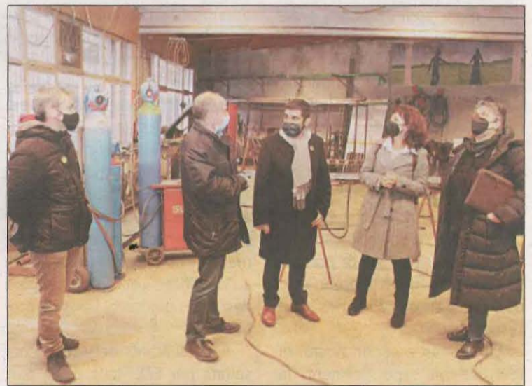
El centre de formació es modernitzarà

Tres dotacions dels Bombers de la Generalitat de Catalunya van haver d'intervenir per apagar el foc que va cremar una caravana que estava aturada en un bancal al Pla de les Moles, a Castellans. Els fets van tenir lloc a les 17.14 hores. D'altra banda, a les 18.21, una dotació de bombers van apagar un foc al marge de l'A-2 a Alcarràs.