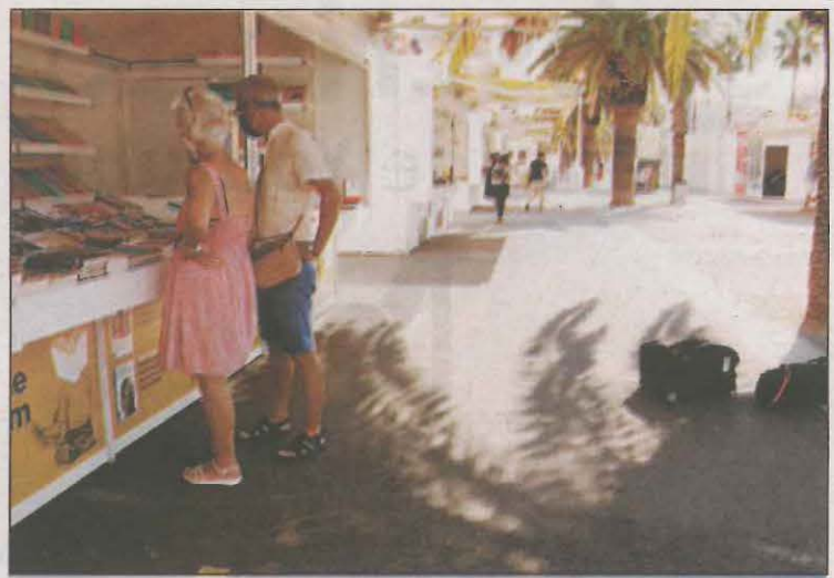
L'any passat ja es va ubicar en aquest emplaçament

La 38a edició de La Setmana del Llibre en Català es va celebrar del 9 al 13 del passat mes de setembre i va acollir 380 activitats, 100 d'aquestes, signatures de llibres en una edició traslladada al la Fusta.