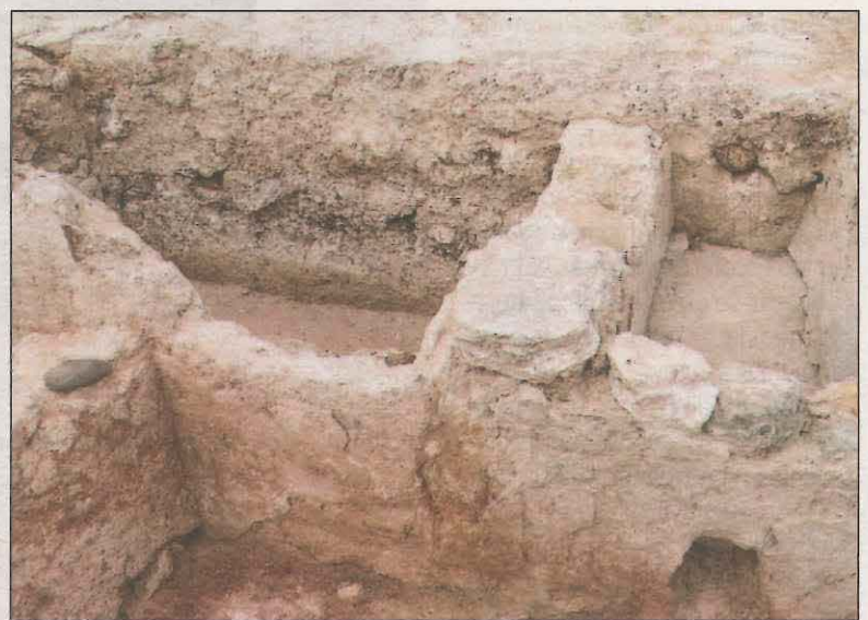
FOTO: A.J. Castelló de Farfanya/ Fins ara se'n desconeixia la seva existència

Així doncs, després de fer totes les tasques pertinents, s'ha pogut trobar aquesta estructura desconeguda fins ara. És per això que també es treballa per col·laborar amb alguna universitat com la UAB o UB per fer excavacions.