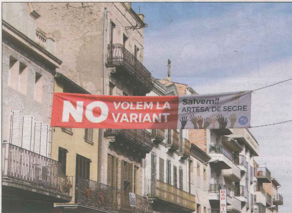
Una de les pancartes que es poden veure als carrers d'Artesa de Segre