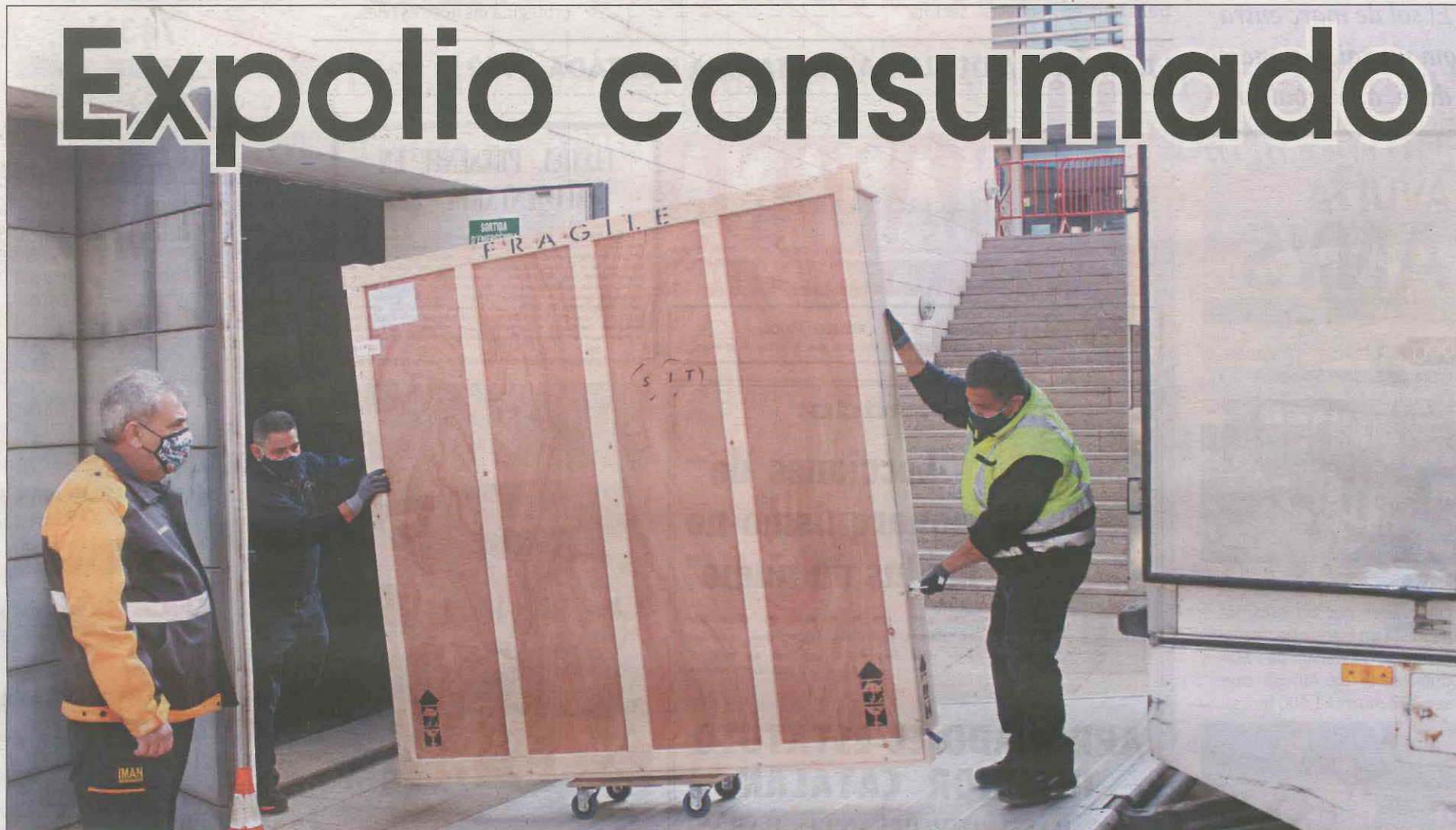
La empresa encargada del transporte de las obras culminó ayer el traslado a Barbastro de la cuarentena de piezas que aún quedaban en el Museu de Lleida

Lleida se despide de las obras entre críticas al "silencio" del Govern y la petición de auxilio al nuevo Parlament