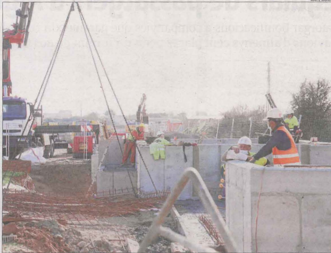
Obres de construcció de la depuradora a Torre-serona ahir.

Segons assenyala el mateix estudi de l'ACA, l'aigua per a