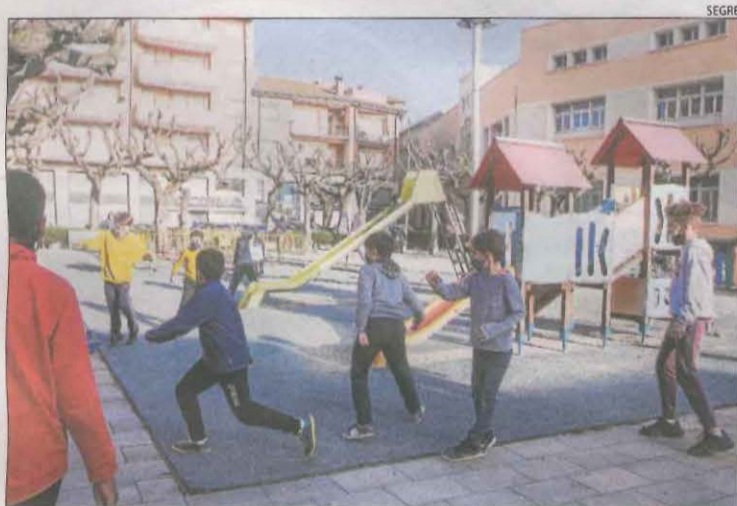
Un dels parcs infantils de Tàrraga que ahir van reobrir.

D'altra banda, a les comarques de Lleida hi ha 67 classes confinades, una menys, i 1.158 estudiants i docents en quarantena, segons Educació. El departament ja registra com a tancada per Covid la llar d'infants Tic Tac de Lleida, com va avançar aquest diari. En canvi, encara no hi apareix l'escola bressol de Benavent de Segrià. L'escola Mare de Déu de Talló de Bellver de Cerdanya segueix amb sis grups aïllats.