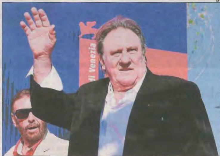
Imatge d'arxiu de l'actor francès Gérard Depardieu.

Els fets haurien tingut lloc al domicili parisenc de l'actor el 7 i el 13 d'agost del 2018, segons van indicar llavors els mitjans