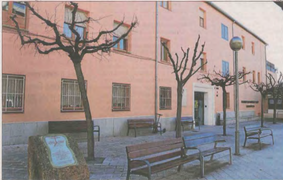
Imatge d'arxiu de la residència de Tremp, que està intervinguda des de finals de novembre.

Argimon assegura que la vacunació evita uns 600 decessos al mes en aquests centres || Les residències 'roges' passen de quatre a tres en una setmana