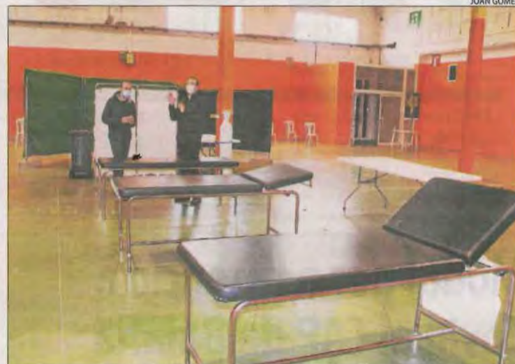
El pavelló firal de Mollerussa acull vacunacions des d'avui.

Al juny podrien estar vacunats entre el 30% i el 40% de catalans