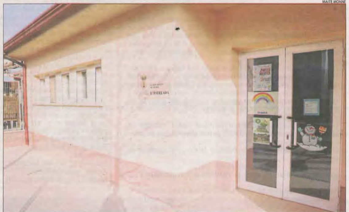
Imatge de l'escola bressol de Benavent de Segrià, ara tancada al detectar-s'hi un positiu.

Davant de l'increment de casos, l'ajuntament de Benavent ha tancat parcs infantils i equipaments com la biblioteca i el poliesportiu. Per la seua part, al consistori només s'atendrà els veïns amb cita prèvia.