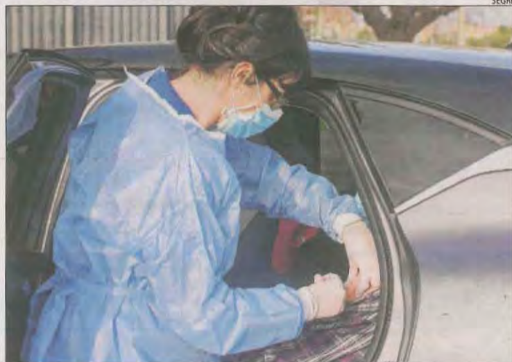
Una sanitària vacuna una persona al cotxe a Tàrrrega.