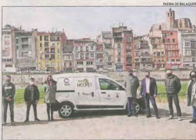
Presentació de la iniciativa ahir a Balaguer.