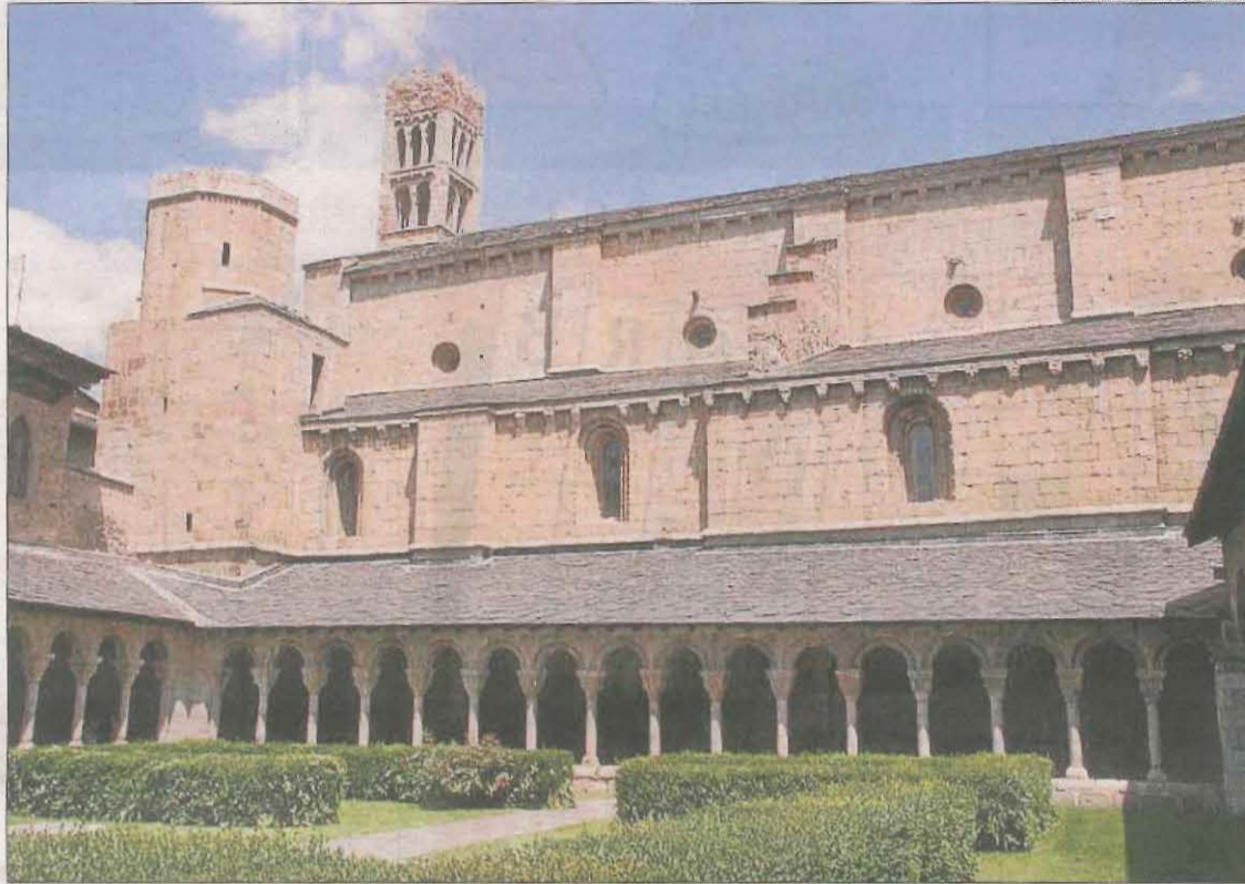
La catedral de Santa Maria de la Seu d'Urgell apareix a la llista de béns immatriculats.

Dels béns immatriculats a la província de Lleida, el 40% corresponen a construccions dedicades al culte com temples, ermites, capelles, conjunts eclesíastics i santuaris, mentre que un 50% són terrenys, sobretot rústics. La resta d'inscripcions són edificis civils com rectories