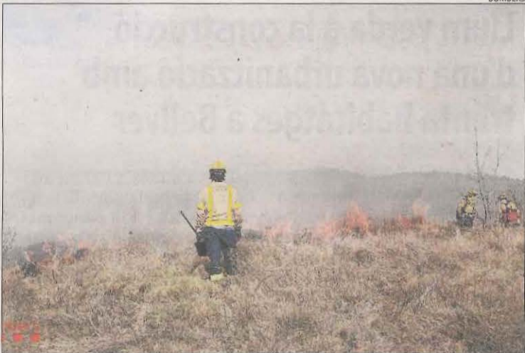
Efectius ahir a la crema de massa forestal a Torallola.