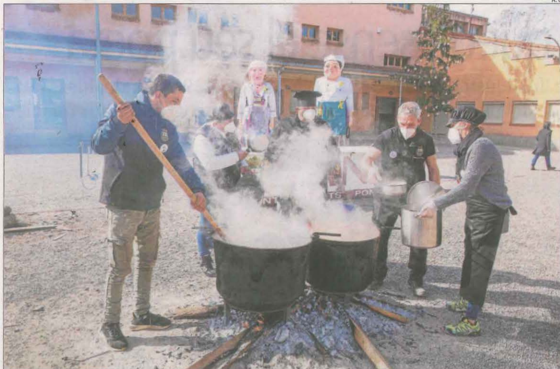
La retransmissió del Ranxo de Ponts es va fer des del pati de l'escola del municipi.