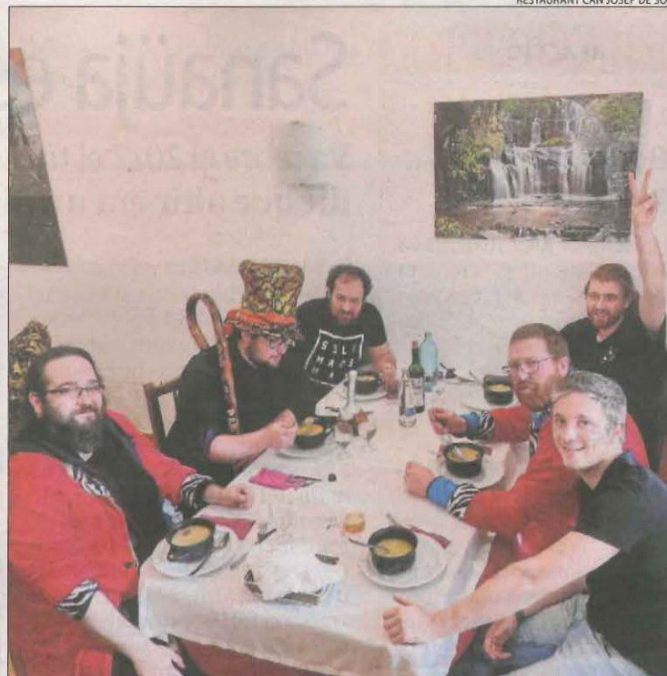
Comitiva del Carnaval de Sort amb la seua ració gratuïta d'escudella.