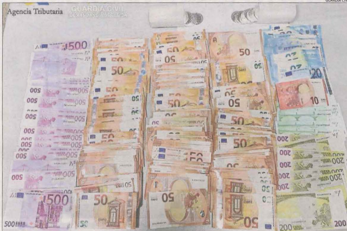
Imatge dels diners que l'home portava amagats en una bossa de viatge.

LA SEU D'URGELL | La Guàrdia Civil va intervenir divendres passat a la duana de la Farga de Moles un total de 29.820 euros a un home que va ser denunciat per una infracció de blanqueig de capitals. La intervenció es va produir cap a les 19.30 hores, quan els agents van donar l'alto a un Land Rover procedent d'Andorra. Davant de les sospites d'una possible infracció, van fer un minuciós escorcoll del vehicle i van trobar-hi a l'interior una bossa de viatge propietat d'un dels ocupants, un home de 70 anys de nacionalitat portuguesa, que contenia 30.820 euros. A la mateixa bossa de viatge, l'infractor portava 50 monedes de plata de col·lecció, valorades en 1.750 euros. Una vegada verificades les quantitats de la intervenció pels agents a les dependències de l'Agència Tributària, i en presència de l'Oficial de Viatgers, es va procedir a aixecar acta per la comissió d'una infracció a la normativa sobre blanqueig de capitals, al superar la quantitat que es regula en l'esmentada normativa així com una altra acta per infracció a la normativa de contraban. L'infractor va continuar el viatge amb 1.000 euros en concepte de "mínim de supervivència". Les monedes de plata també van ser deco-