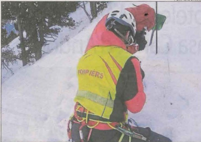
Test d'estabilitat de la neu a Artiga de Lin.