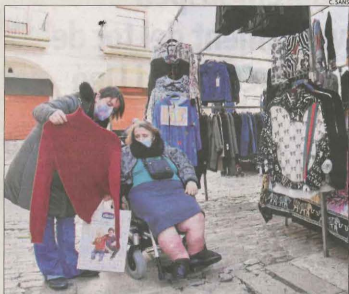
Una usuària d'una residència de la Seu que va sortir ahir.

■ Els brots en residències segueixen a la baixa i actualment hi ha quatre centres rojos, tots de la regió sanitària de Lleida, segons Salut. Són els de Malpartit, Torre-serona, el municipal de Juneda i el Centre Gerontològic Myces. Al centre de Malpartit ahir hi va haver un altre cribratge després que a l'últim no es detectessin positius. Al de de Juneda, fonts pròximes van assenyalar que hi ha un avi que va estar ingressat i va donar positiu al tornar. A la residència de Vielha han reprès les visites després que el centre hagi passat de roig a taronja (amb positius, però sota control). Així mateix, 80